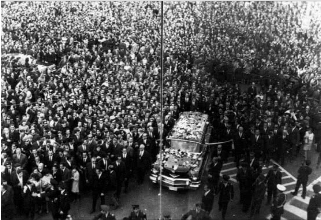
φωτογραφία από την κηδεία του Παλαμά