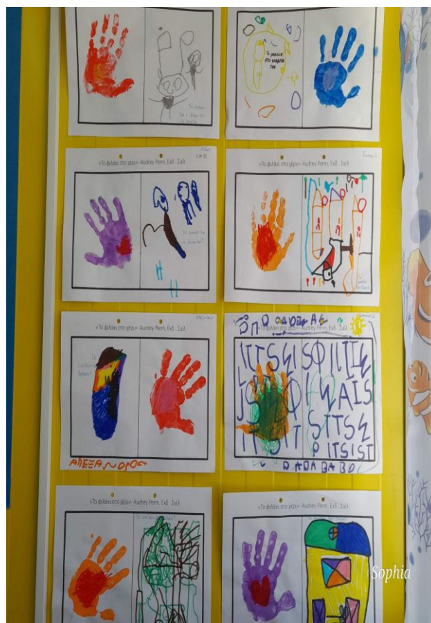
Ο ήλιος που ενώνει το σπίτι με το σχολείο