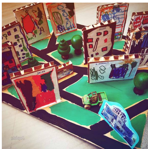
Από το σπίτι στο σχολείο