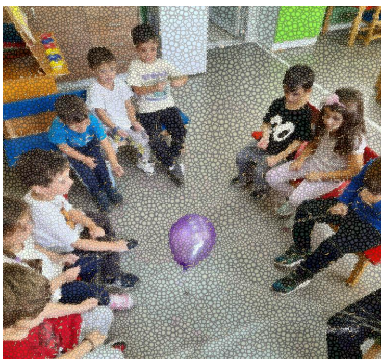
Όταν είμαστε ομάδα καταφέρνουμε πολλά!