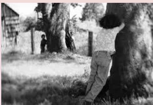
Δέσποινα, Ζαχαρένια, Δ' τάξη

Το κρυφτό ή κρυφτούλι είναι παιδικό ομαδικό παιχνίδι, στο οποίο ο ένας παίκτης της ομάδας προσπαθεί να βρει τους υπόλοιπους οι οποίοι έχουν κρυφτεί. Στο κρυφτούλι ένα παιδί μετράει με κλειστά τα μάτια μέχρι το εκατό και τα άλλα κρύβονται. Μόλις το παιδί τελειώσει το μέτρημα, ανοίγει τα μάτια του και αρχίζει να ψάχνει. Το παιδί που φυλάει πρέπει μόλις δει ένα από τα παιδιά που κρύβονται να τρέξει στο μέρος όπου μετρούσε και να πει μια συγκεκριμένη φράση πριν προλάβει να έρθει το παιδί που κρύβεται και να πει αυτό τη συγκεκριμένη φράση.