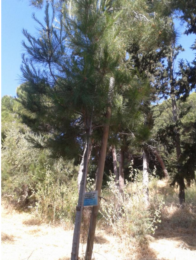
π ε ύ κ ο

Περπατώντας είχαμε την ευκαιρία να παρατηρήσουμε πολλά φυτά όπως πεύκα, έλατα, πικροδάφνες, ελιές, αγγελικές και πολλά αγριολούλουδα.