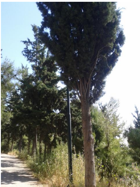
έ λ α τ ο