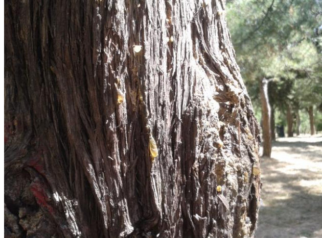
ρ ε τ σ ί ν ι σ τ ο ν κ ο ρ μ ό π ε ύ κ ο υ