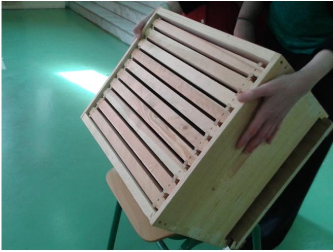
Είδαν από κοντά κυψέλη

Είδαν από κοντά, άγγιξαν κι έμαθαν πώς ο μελισσοκόμος συλλέγει με την «ξύστρα» του το μέλι από την κηρήθρα.