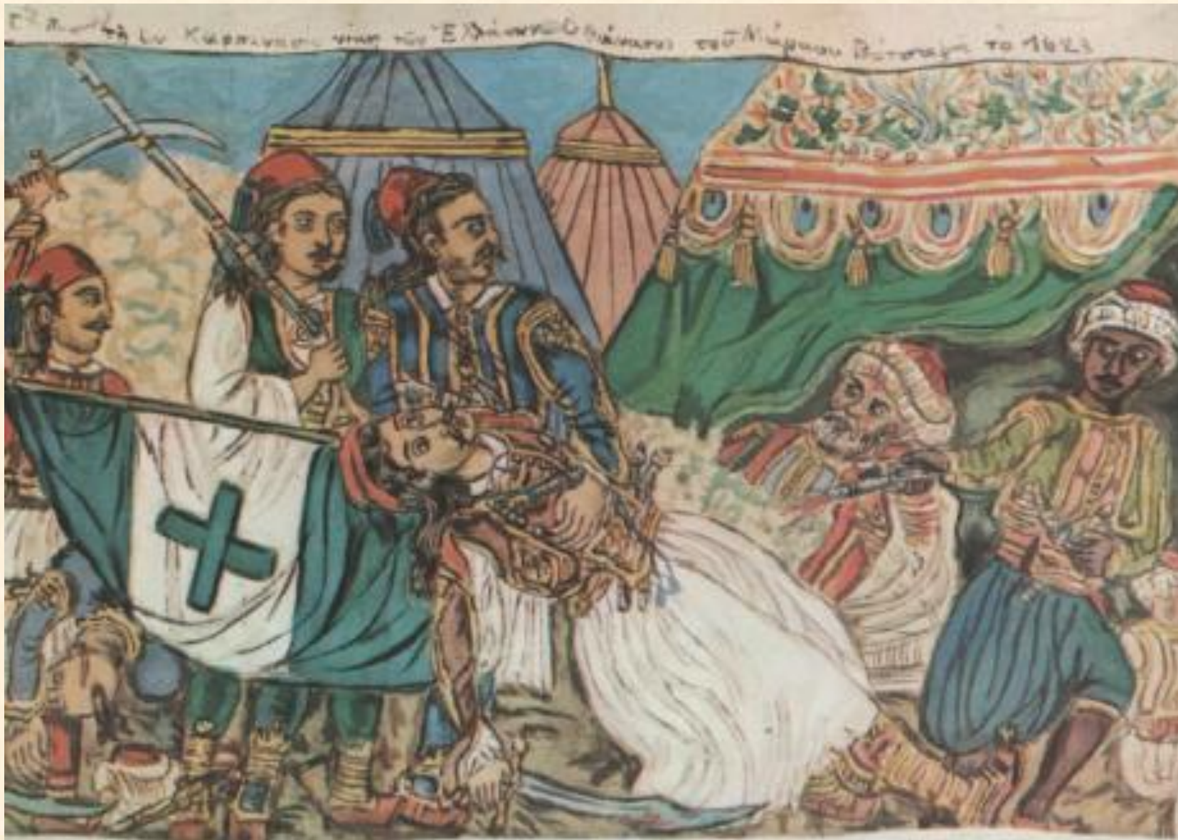
Ο θάνατος του Μπότσαρη, Θεόφιλος

Ο λαϊκός ζωγράφος Θεόφιλος αποτυπώνει σε έναν πίνακά του το θάνατο του Μάρκου Μπότσαρη.