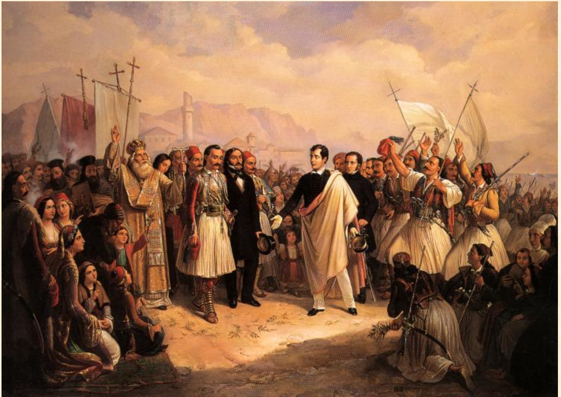
Η υποδοχή του Λόρδου Βύρωνα στο Μεσολόγγι Θεόδωρος Βρυζάκης (1853). Λάδι σε καμβά, 155 × 213 εκ. Εθνική Πινακοθήκη