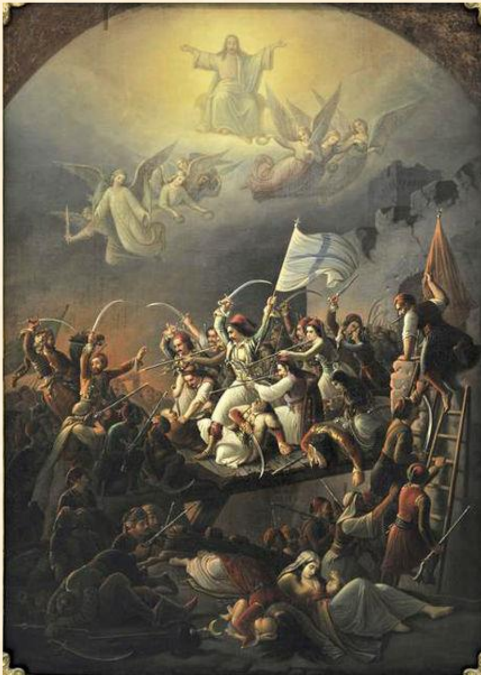
Η Έξοδος του Μεσολογγίου, Θεόδωρος Βρυζάκης (1826). Λάδι σε καμβά, 169 x 127 εκ. Εθνική Πινακοθήκη