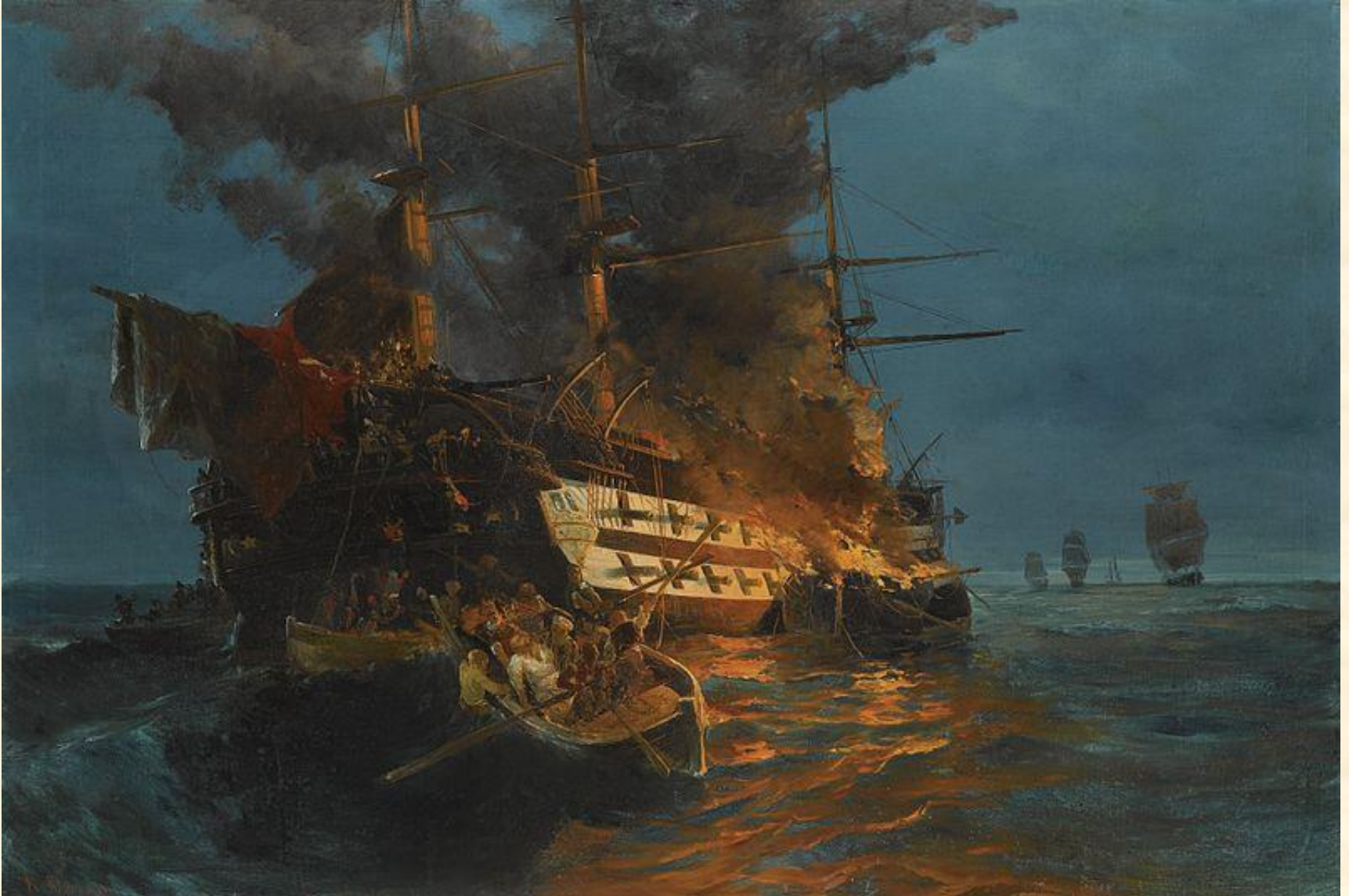
Η πυρπόληση της τουρκικής φρεγάτας, Κωνσταντίνος Βολανάκης. Λάδι σε καμβά, 92 × 135 εκ. Αθήνα, ιδιωτική συλλογή

Η πυρπόληση της τουρκικής φρεγάτας από τον Κανάρη. Δαυίδ και Γολιάθ. Βάρκες εναντίον φρεγάτας. Ο Βολανάκης αποτυπώνει στον πίνακά του την ανδρεία και την τόλμη του Κανάρη και των άλλων μπουρλοτιέρηδων.