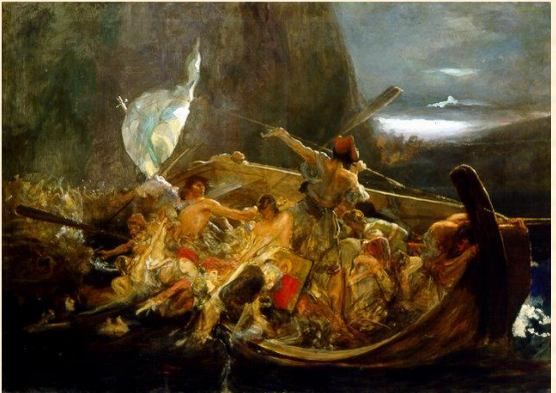
Μετά την καταστροφή των Ψαρών, Νικόλαος Γύζης (1896–98). Λάδι σε μουσαμά, 133 x 188 εκ. Εθνική Πινακοθήκη