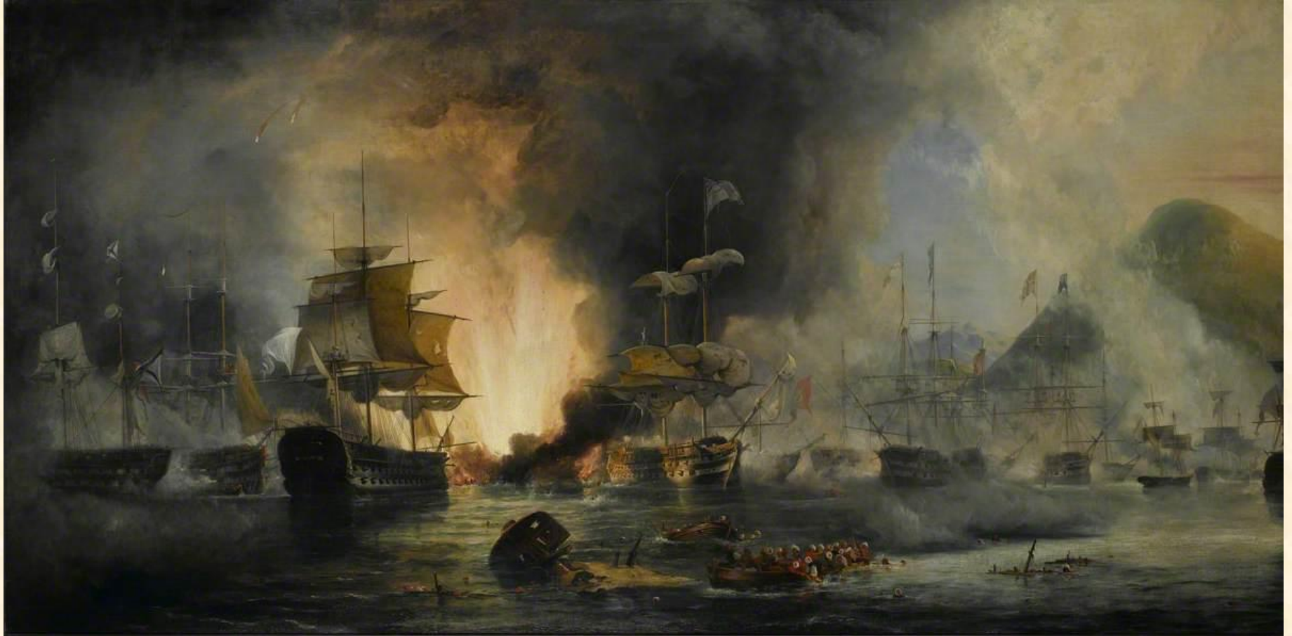
Ναυμαχία του Ναυαρίνου, George Philip Reinagle (1828). Λάδι σε καμβά, 121,9 x 243,8 εκ. Εθνικό Ναυτικό Μουσείο, Λονδίνο