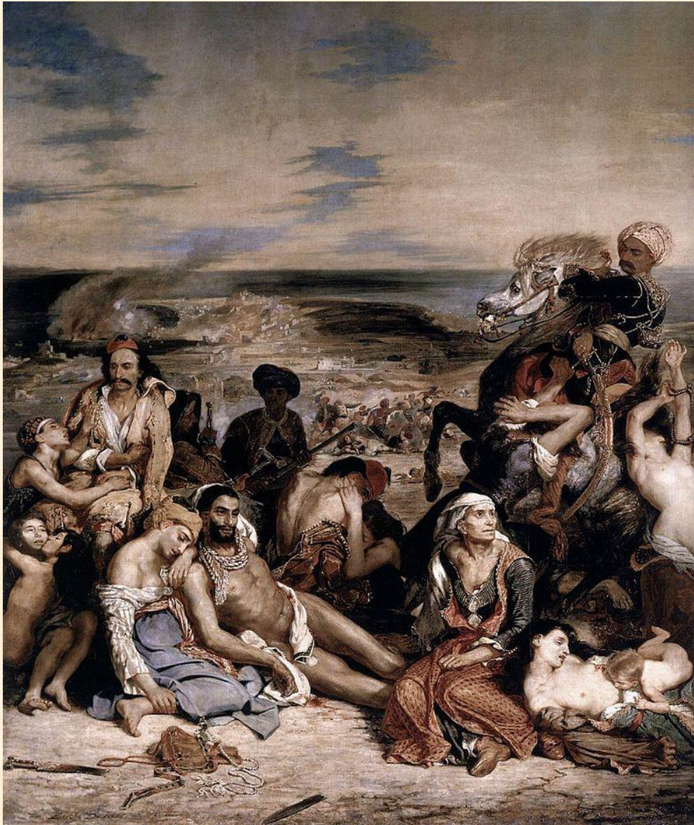
Η σφαγή της Χίου, Ευγένιος Ντελακρουά (1824). Ελαιογραφία σε καμβά, 419 εκ. x 354 εκ. Μουσείο του Λούβρου, Παρίσι

Ο Ντελακρουά τα πραγματικά γεγονότα που παρουσιάζει στους πίνακές του από την Ελληνική Επανάσταση, δεν τα έζησε αλλά είχε το σφοδρό πόθο να τα ζήσει. «Η σφαγή της Χίου» που χρειάστηκε επτά μήνες για να τον ολοκληρώσει, ήταν ο πρώτος από μια σειρά πινάκων εμπνευσμένων από την Ελληνική Επανάσταση.