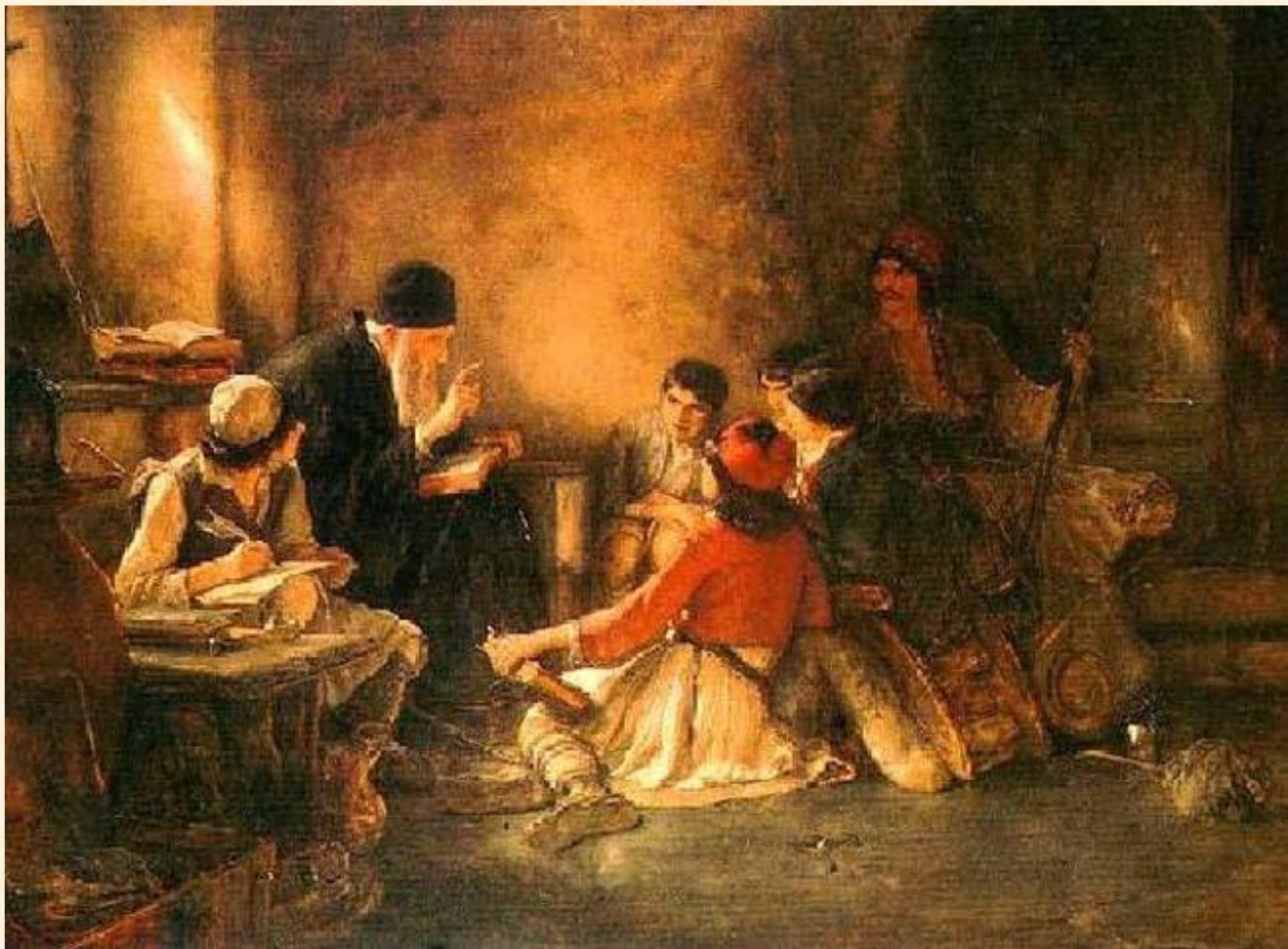
Το κρυφό σχολειό, Νικόλαος Γύζης (1885-86). Λάδι σε μουσαμά, 58 × 73 εκ. Ιδιωτική συλλογή