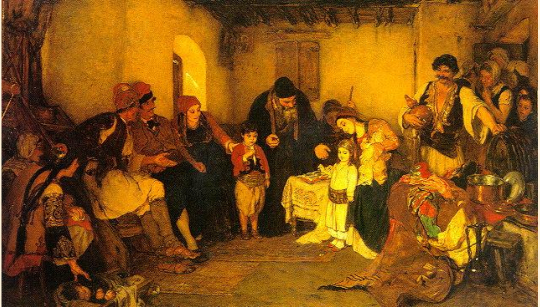
Τα αρραβωνιάσματα, Νικόλαος Γύζης (1875). Λάδι σε μουσαμά, 104 x 156 εκ. Εθνική Πινακοθήκη

Τα «Αρραβωνιάσματα», μια σκηνή που γινόταν σε κάθε σπίτι που ήθελε να προφυλάξει τα παιδιά από το παιδομάζωμα. Μια σκηνή που περιγράφει την Ελληνική πραγματικότητα εκείνης της εποχής και κρύβει το φόβο του παιδομαζώματος.