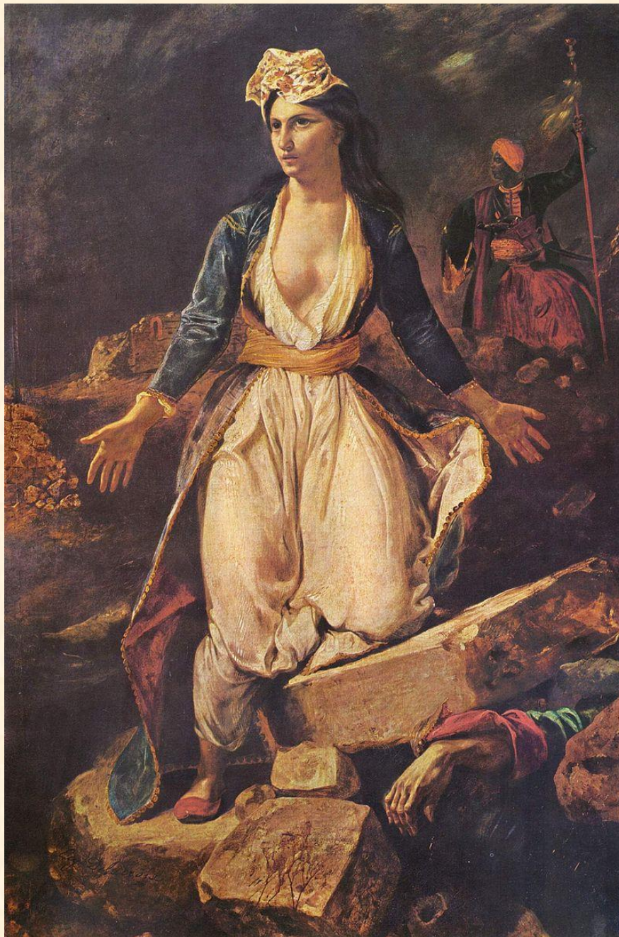
Ευγένιος Ντελακρουά, «Η Ελλάδα ξεψυχά στα Ερείπια του Μεσολογγίου»