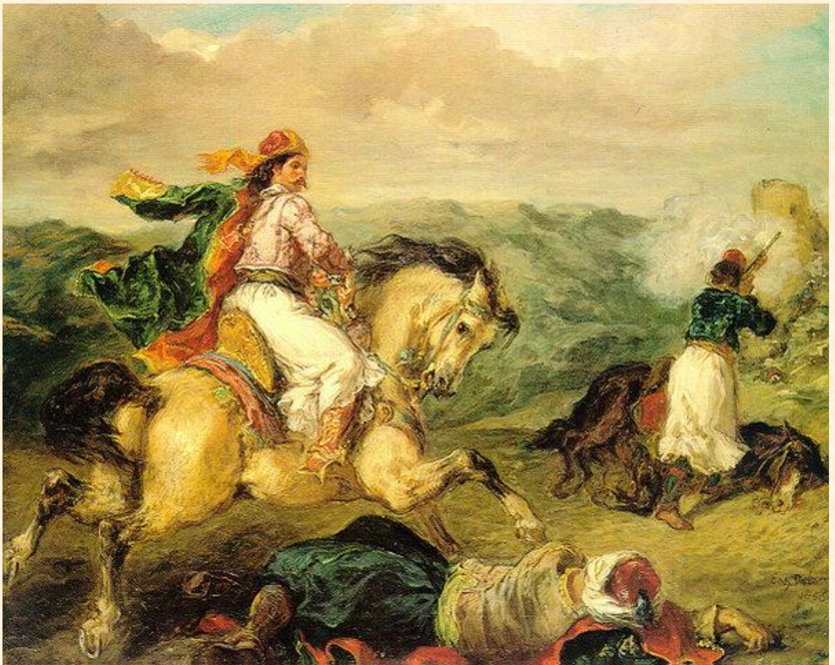
Ευγένιος Ντελακρουά, «Έφιππος Έλληνας πολεμιστής»