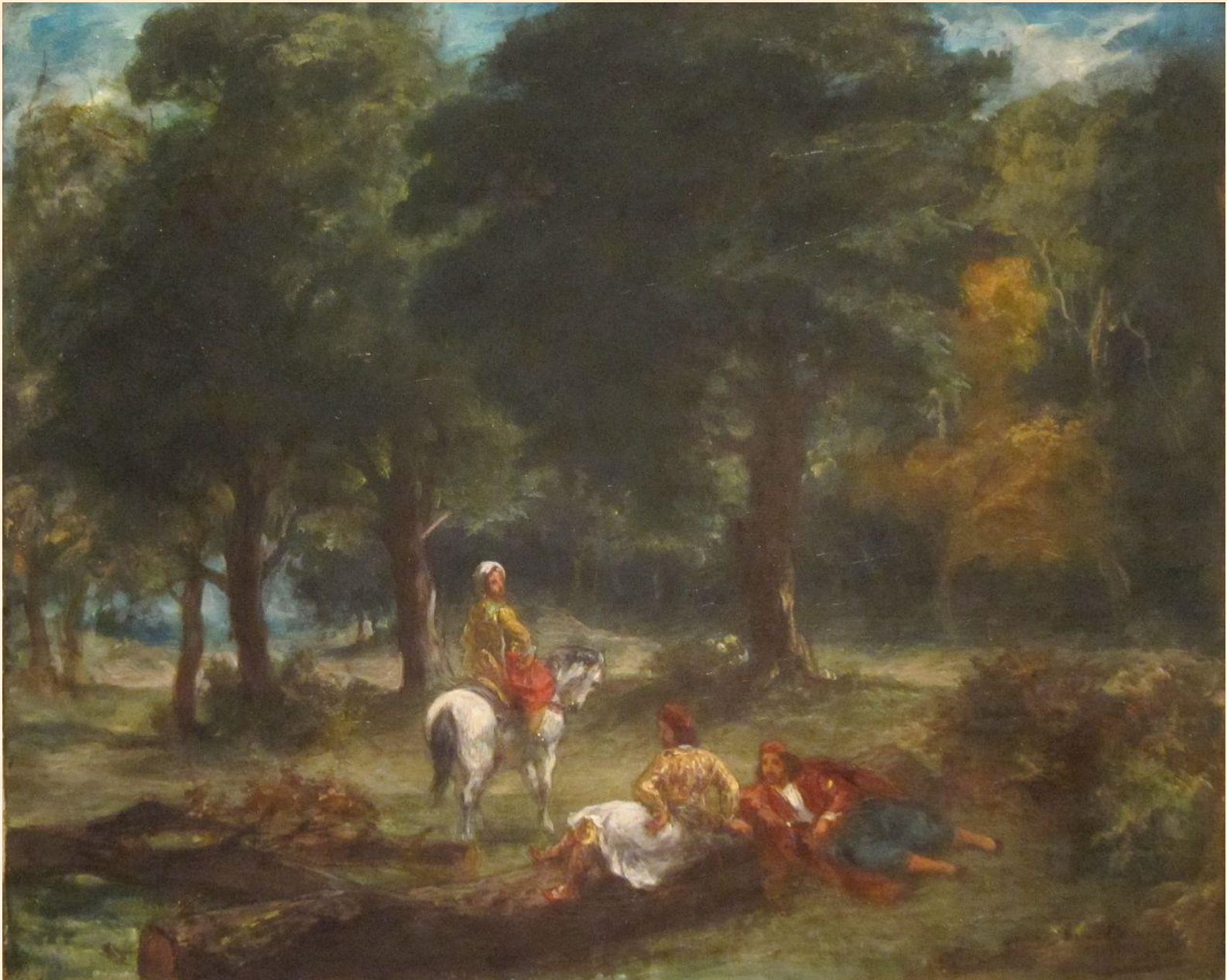
«Έλληνες ιππείς αναπαύονται στο δάσος»