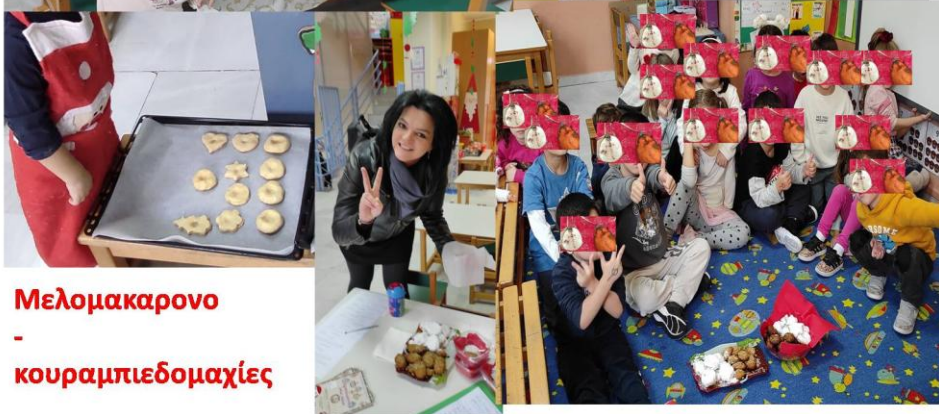
Μελομακαρονο - κουραμπιεδομαχιες