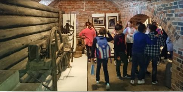
Στο μουσείο της πόλης Utena Utena history museum