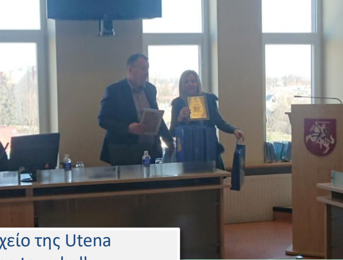
Υποδοχή στο Δημαρχείο της Utena Reception at Utena townhall