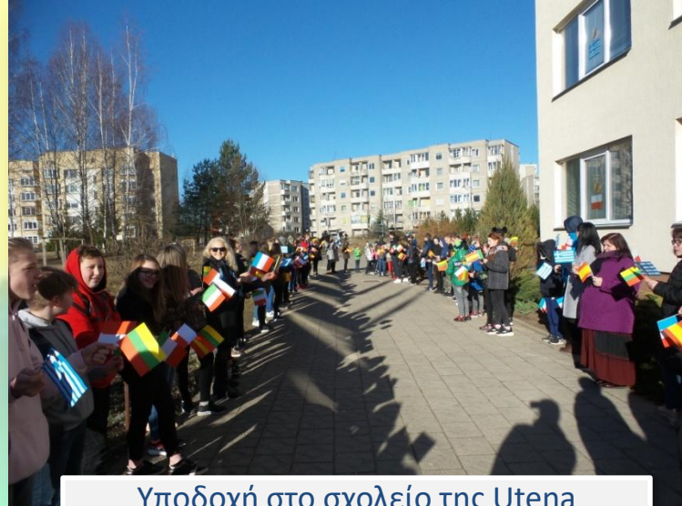
Υποδοχή στο σχολείο της Utena Reception at Utena primary school