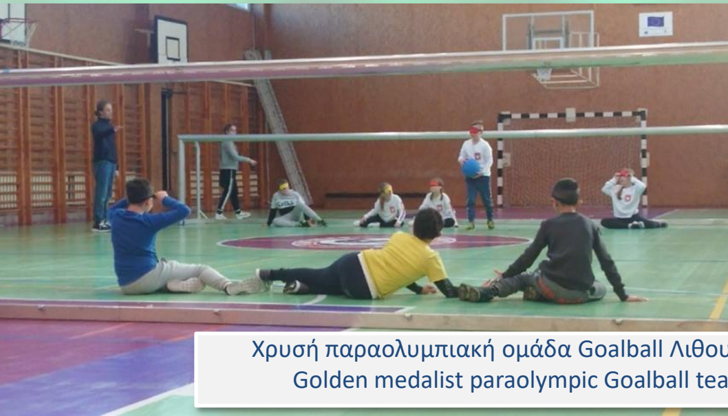
Χρυσή παραολυμπιακή ομάδα Goalball Λιθουανίας Golden medalist paraolympic Goalball team