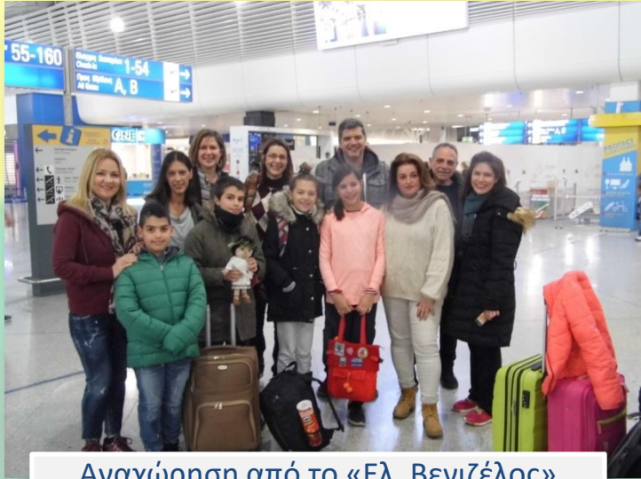
Αναχώρηση από το «Ελ. Βενιζέλος» Departure from airport