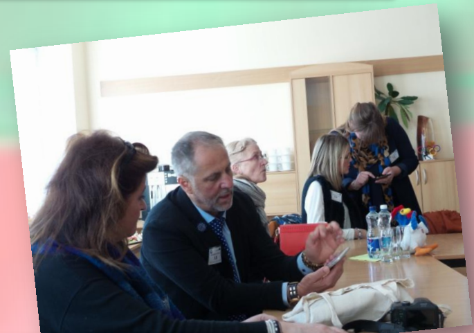
Πρώτη συνάντηση αντιπροσωπειών First meeting of delegations