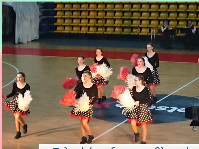
Τελετή έναρξης στο αθλητικό κέντρο Opening ceremony at sports center