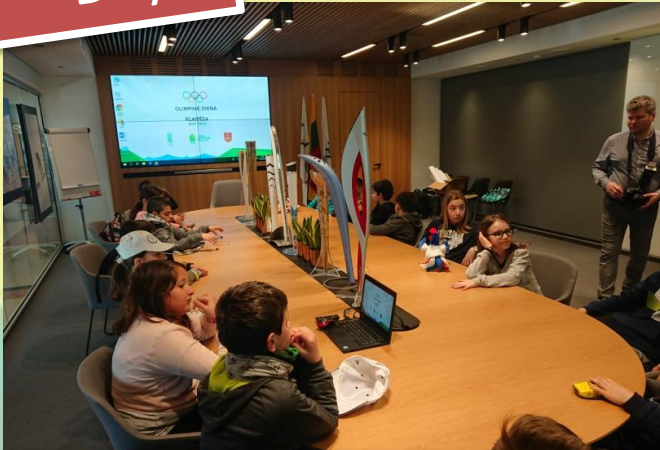
Στην Ολυμπιακή επιτροπή στο Vilnius Olympic committee at Vilnius