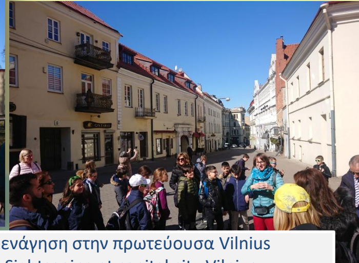
Ξενάγηση στην πρωτεύουσα Vilnius Sightseeing at capital city Vilnius