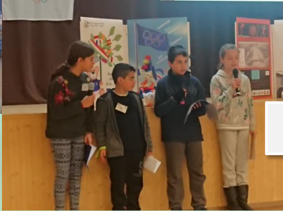
Παρουσιάσεις video των αντιπροσωπειών Delegations' video presentations