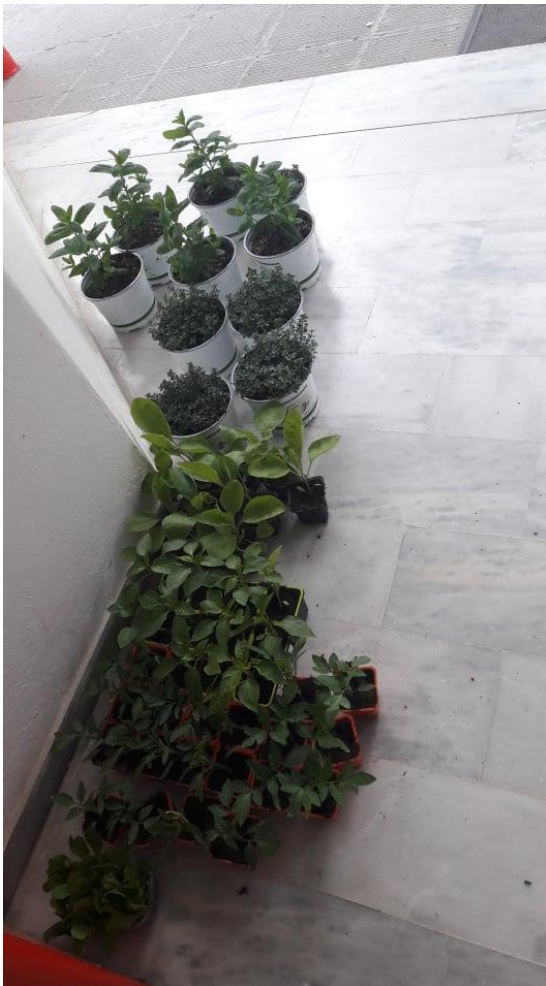
Τα φυτά είχαν έρθει πριν τα παιδιά.