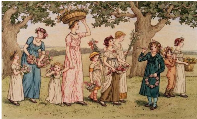
ΚΑΤΕ GREENAWAY ΠΡΩΤΟΜΑΓΙΑ