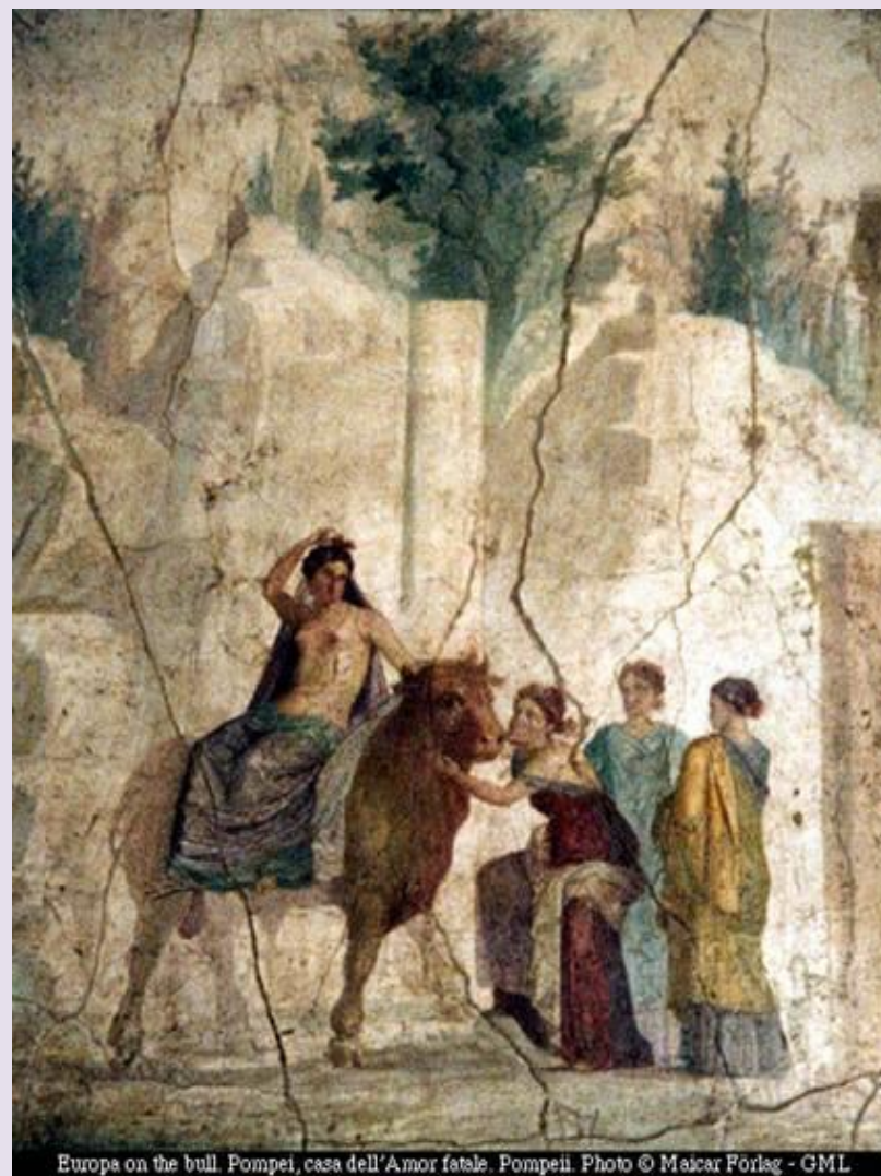
Europa on the bull. Pompeii, casa dell'Amor fatale. Pompeii.

Όταν μεγάλωσε, μια μέρα πήγε στα λιβάδια της παραλία, για να παίξει με τις φίλες της και να μαζέψει λουλούδια. Εκεί συνάντησε το θεό Δία. Εκείνον αμέσως τον χτύπησε ο Έρωτας και για να την πλησιάσει μεταμορφώθηκε σε ήρεμο, εύσωμο και δυνατό ταύρο και πήγε δίπλα της κάνοντας δήθεν ότι βόσκει, σκεφτόμενος με τι τρόπο θα την κατακτούσε.