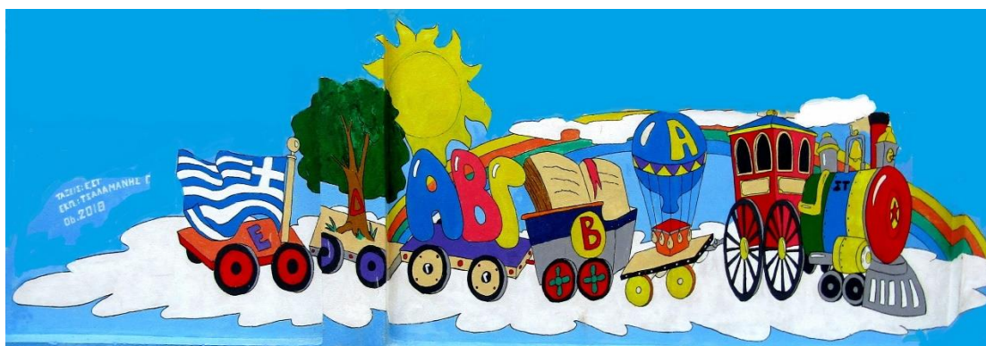
Εικόνα: Τοιχογραφία στη νότια πλευρά του σχολείου

Θέματα που ανακύπτουν και δεν προβλέπονται από τον Κανονισμό, αντιμετωπίζονται κατά περίπτωση από την Διευθύντρια του σχολείου και τον Σύλλογο Διδασκόντων, σύμφωνα με τις αρχές της παιδαγωγικής επιστήμης και την εκπαιδευτική νομοθεσία, σε πνεύμα συνεργασίας με όλα τα μέλη της σχολικής κοινότητας.