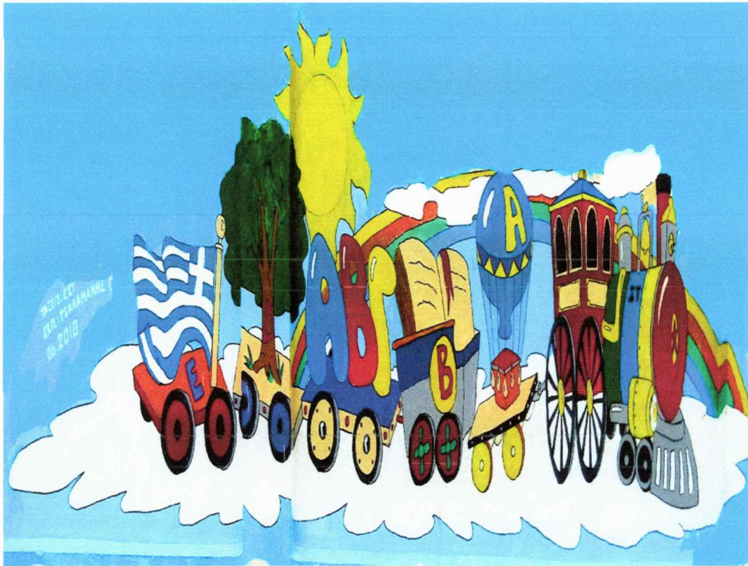
Εικόνα: Τοιχογραφία στη νότια πλευρά του σχολείου

Το πολύχρωμο τρένο των γραμμάτων, των λέξεων και των ιδεών ξεκίνησε από το 12 ο Δημοτικό Σχολείο Αλεξανδρούπολης για το μεγάλο ταξίδι της γνώσης με προορισμό τους σταθμούς, τα χωριά και τις πόλεις της Ελλάδας και της Ευρώπης. Ανέβα και εσύ σ' ένα πολύχρωμο βαγόνι να νιώσεις τη χαρά της μάθησης και της ανακάλυψης της γνώσης!