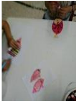
σε έναν τρισδιάστατο καθαρό βυθό.