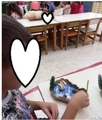
και το μεταφέρουν σε μια κατασκευή