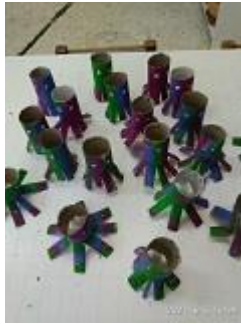
Φτιάχνουν ποίημα για