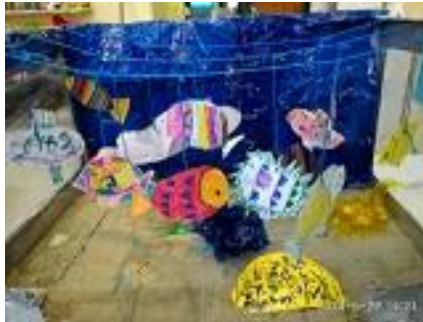
Αποφασίζουν να μεταφέρουν

στην κοινότητα το πρόβλημα της ρύπανσης. Έτσι φτιάχνουν αφίσσα ,