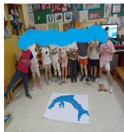
ένα δελφίνι με καπάκια που εκπέμπει