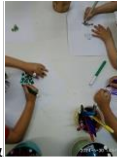
Φτιάχνουν υγιή ψαράκια