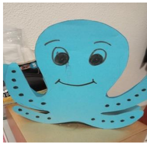
γιορτής στο σπίτι.