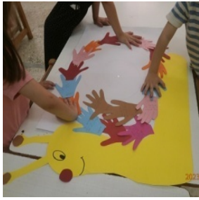
Και το σαλιγκάρι της τάξης με τις παλάμες των παιδιών.