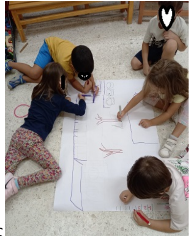
Συνεργάζονται και φτιάχνουν ομαδικές εργασίες