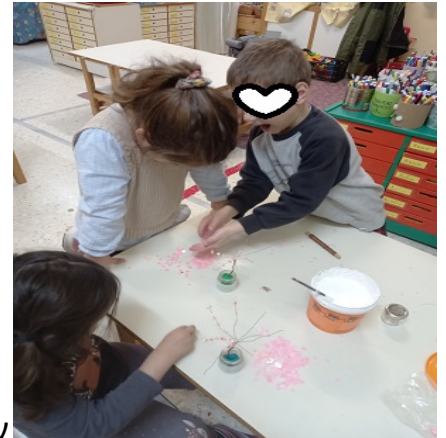
Έμαθαν να συνεργάζονται και δημιουργούν