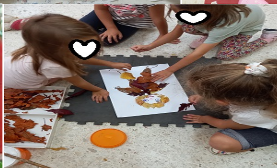
Συνεργασία μέσα από την τέχνη.