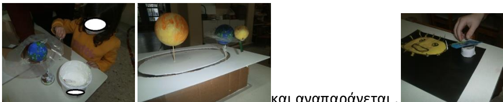
και αναπαράγεται .

Μαθαίνουμε τη δημιουργία εποχών ,μηνών , μέρα-νύχτας, βιωματικά με χορό