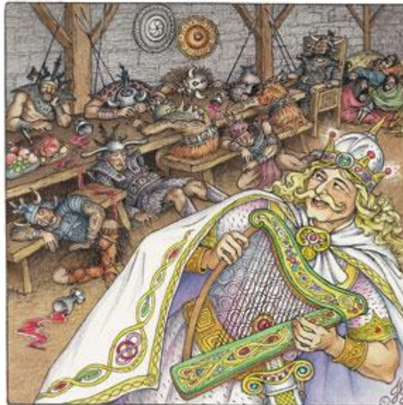
The Dagda's Harp

In Irish mythology, the Dagda was a high priest (παπάς) who had a large and beautiful harp (άρπα). During a war (πόλεμος), a rival (αντίπαλος) tribe (φυλή) stole Dagda`s harp and took it to a forgotten (ξεχασμένο) castle. Dagda followed the tribe and called to the harp. The harp came to Dagda and he struck (χτυπώ) the cords (χορδές). The harp let out the Music of Tears (δάκρυα) and everyone in the castle began to cry. Dagda struck the cords again and the harp played the Music of Mirth (κέφι) and all the warriors (πολεμιστές) began to laugh. Then Dagda struck chords a final time and the harp let out the Music of Sleep. Everyone but Dagda fell into a deep (βαθύς) sleep, allowing (επιτρέποντας) him to escape (δραπετεύω) with his magical harp!