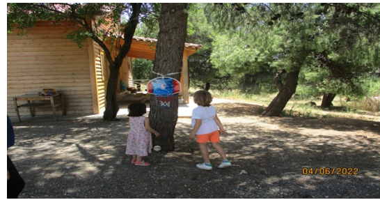
“Από που πάμε στον ήλιο Θανάσάκη” Ασκήσεις χωρικής σκέψης και καλαθοσφαίρισης(Ιούνιος2022)