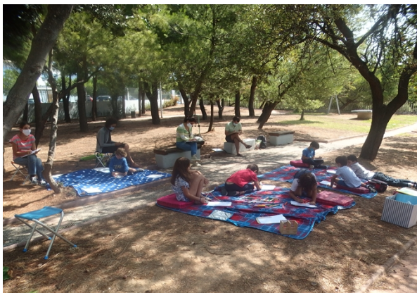
Πάρκο Βριλησίων-Σεπτέμβριος 2020

Πραγματοποιήθηκαν συνολικώς επτά (7) εκπαιδευτικοί “Φιλοσοφικοί περίπατοι στην Φύση” Ενδεικτικές φωτογραφίες: