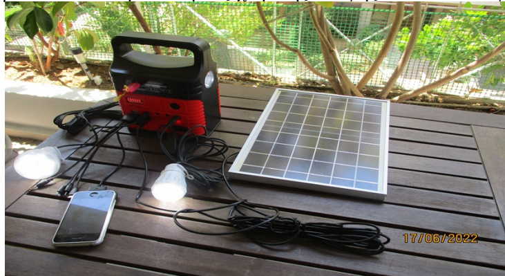
“Από που πάμε στον ήλιο Θανάσάκη” Επίδειξη φωτοβολταϊκού πολυμηχανήματος (Ιούνιος 2022)