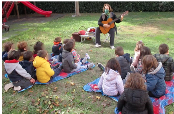
Σε παιδικό σταθμό του Δήμου Βριλησσιών (Νοέμβριος 2021)