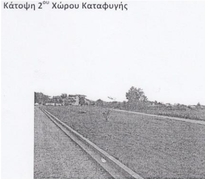
Κάτοψη 2 ου Χώρου Καταφυγής

Διαμορφωμένος χώρος (παρκάκι του 10 ου ) απέναντι από το σχολείο