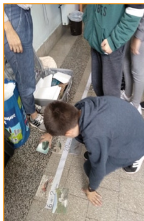
3 ο Δημοτικό Σχολείο Ρόδου