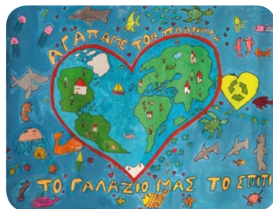
Β' Βραβείο 4ο Δημοτικό Σχολείο Μαρinas-Πολλών Νερών- Γιαννακοχωριού, Δ' Τάξη, Ομάδα 3189(B)