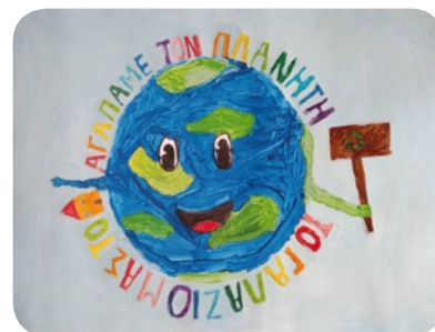
Γ' Βραβείο 7ο Δημοτικό Σχολείο Καβάλας, Ε' Τάξη, Ομάδα 2214(Γ)

Τα Α' Βραβεία έγιναν Αφίσες, όπως κάθε χρόνο, αλλά πιθανόν να κυκλοφορήσουν μόνο ηλεκτρονικά καθώς τα σχολεία παραμένουν κλειστά.