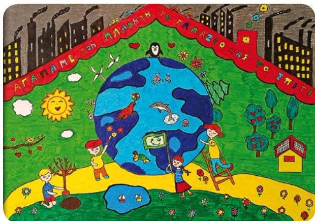
Α' Βραβείο 1ο Δημοτικό Σχολείο Χαϊδαρίου, Γ' Τάξη, Ομάδα 3270(B)