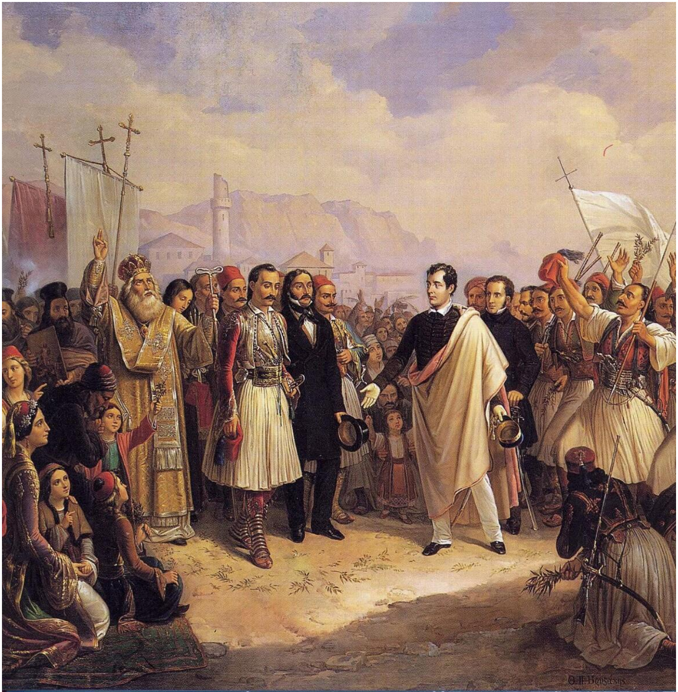
Θεόδωρος Βρυζάκης: Η υποδοχή του Λόρδου Βύρωνα στο Μεσολόγγι