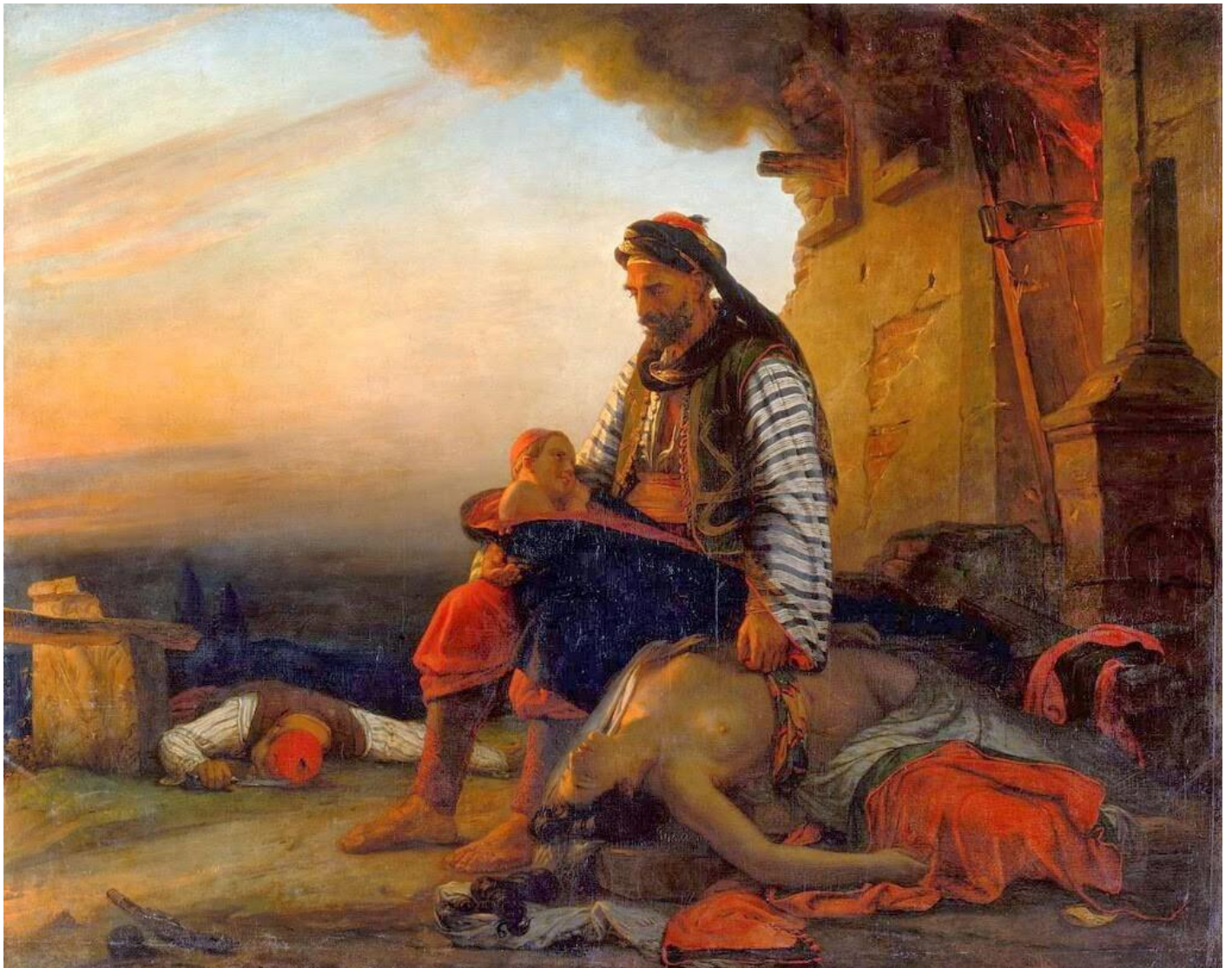
François-Auguste Vinson: Μετά τη σφαγή στη Σαμοθράκη