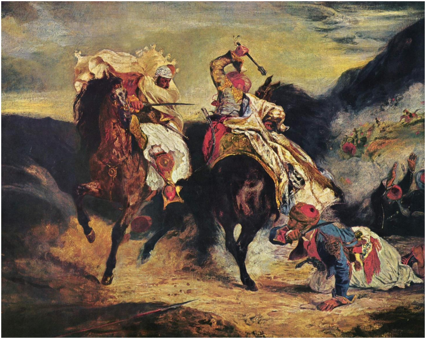
Ευγένιος Ντελακρουά: Ο σκλαβωμένος Έλληνας πολεμά τον πασά