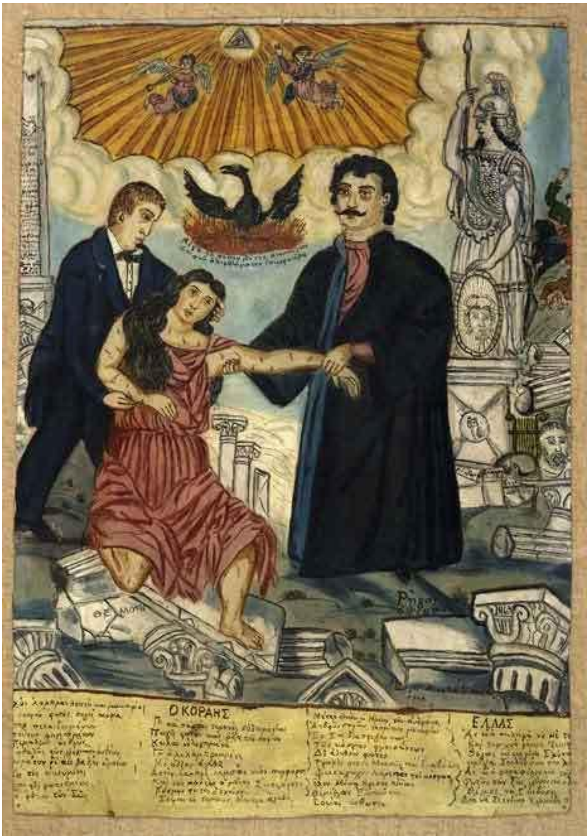
Έργο του Θεόφιλου: Κοραής και Ρήγας ανυψώνουν την Ελλάδα