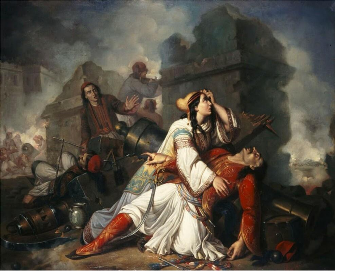
Ντονάτο Φραντσέσκο Ντε Βίβο: Ο θάνατος του Λάμπρου Τζαβέλλα