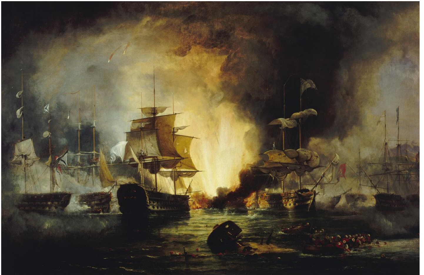
Reinagle George Philip: Ναυμαχία του Ναυαρίνου