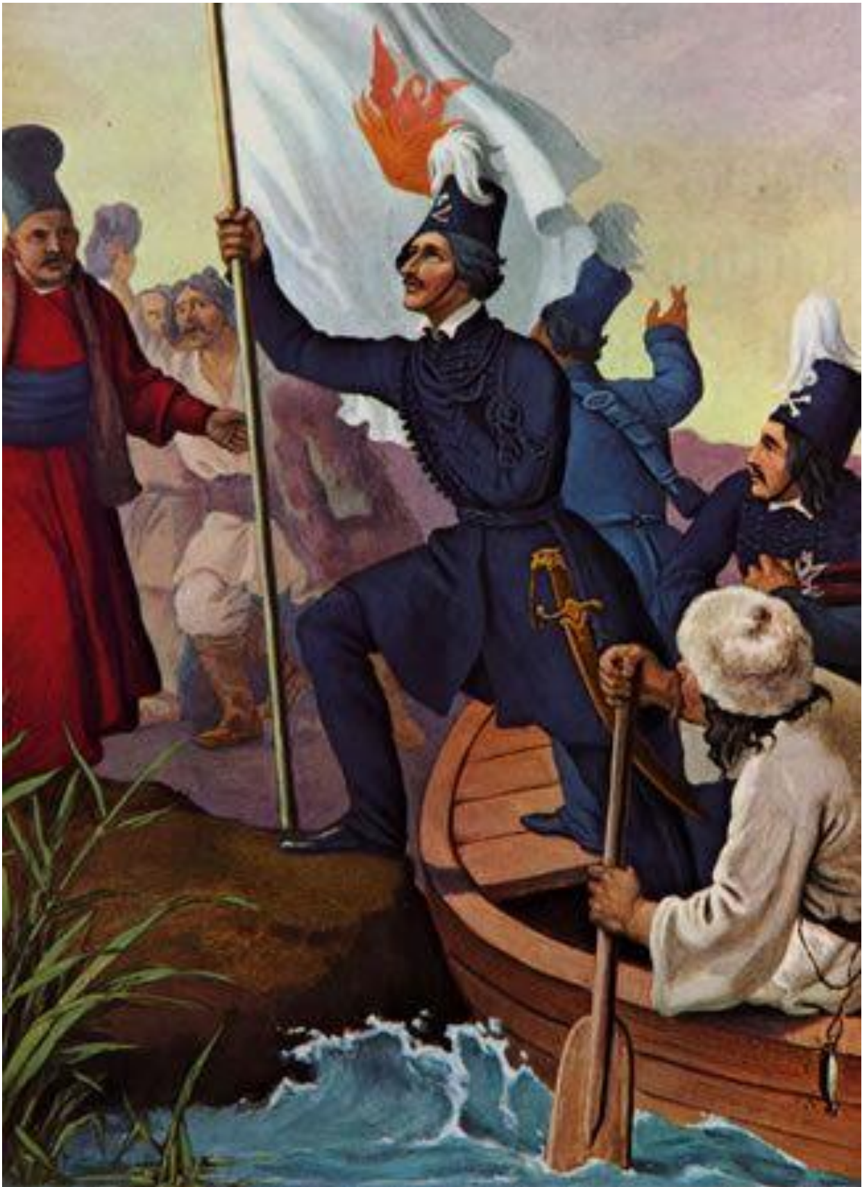
Peter Von Hess: Ο Αλέξανδρος Υψηλάντης διαβαίνει τον Προύθο