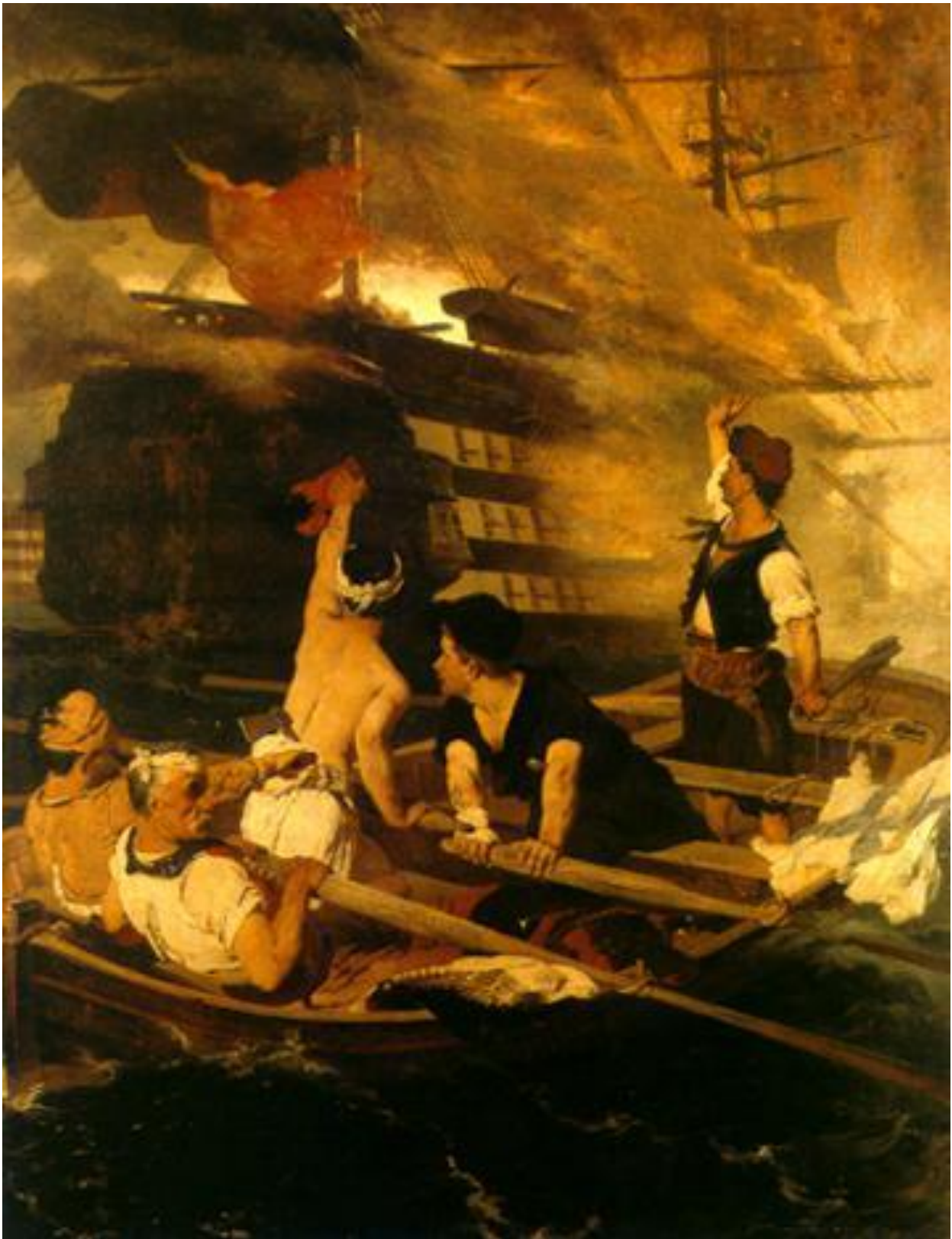
Ν. Λύτρας: Η πυρπόληση της τουρκικής ναυαρχίδας από τον Κανάρη