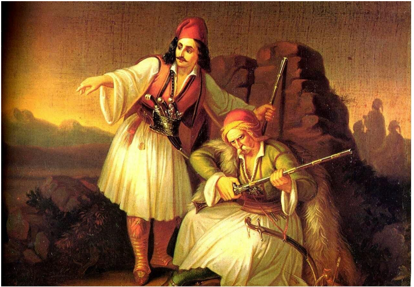
Θεόδωρος Βρυζάκης: Καραούλι