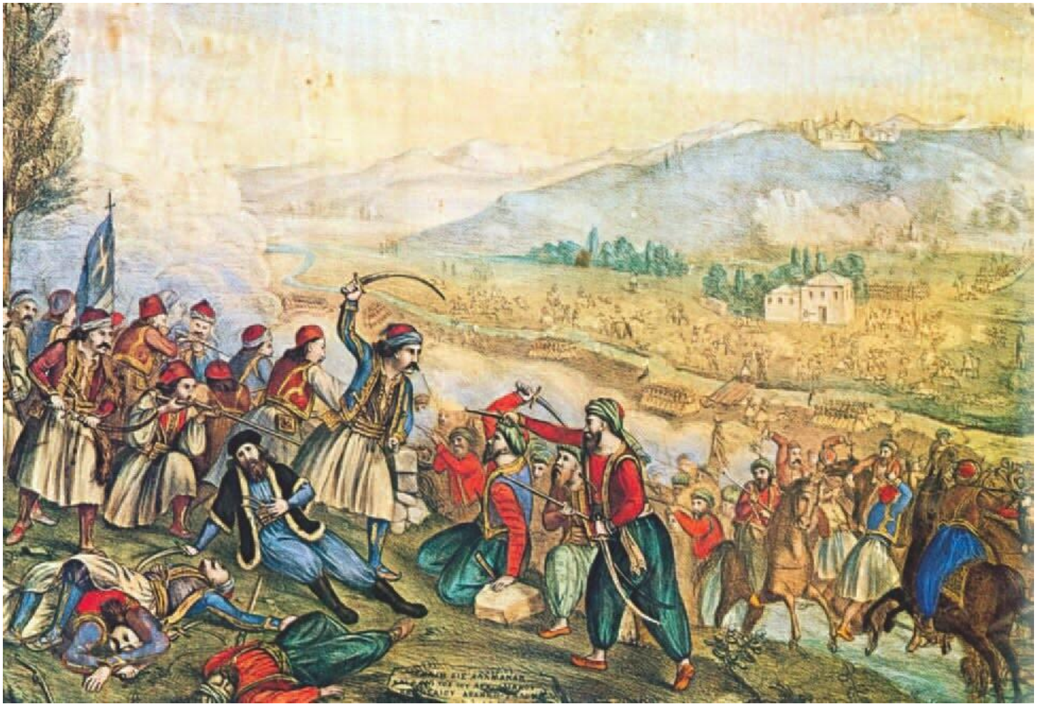
Αλέξανδρος Ησαΐας: Αθανάσιος Διάκος - Η μάχη της Αλαμάνας