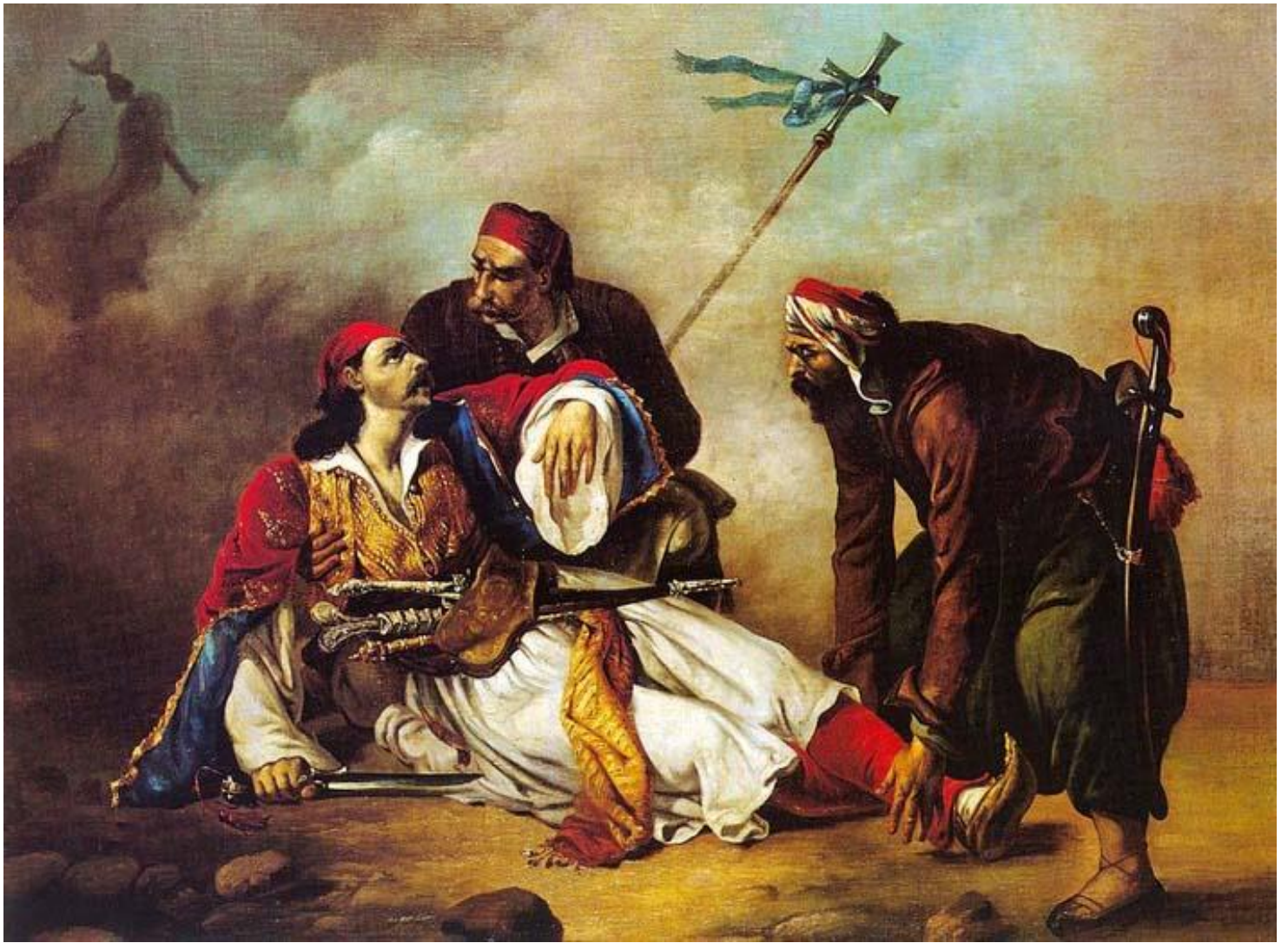
Δ. Τσόκος: Ο θάνατος του Μάρκου Μπότσαρη