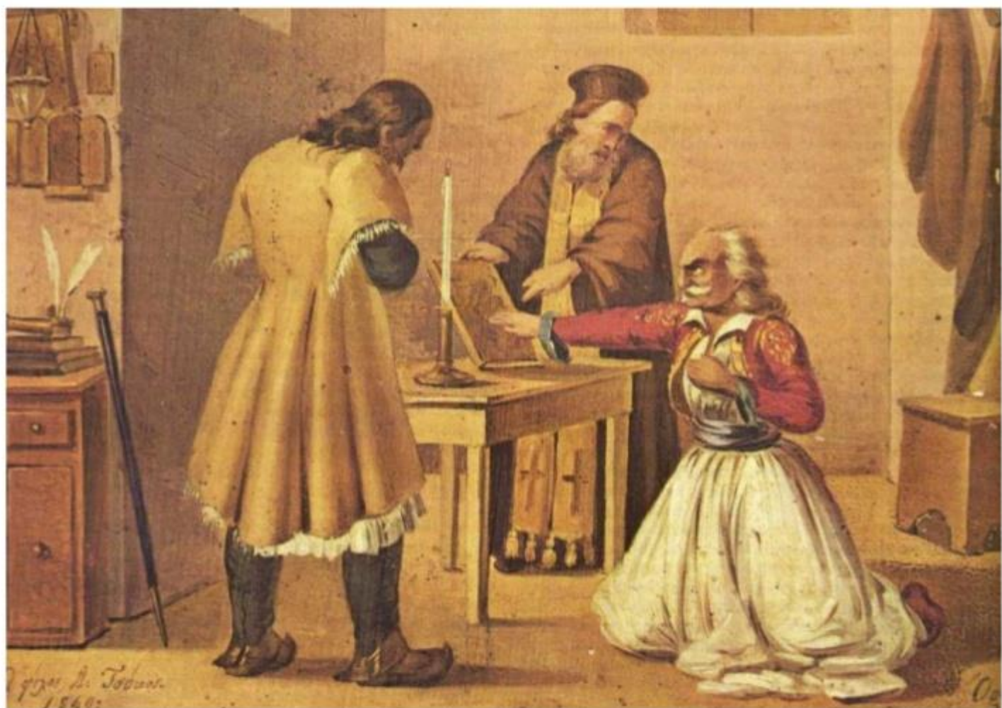
Δ. Τσόκος, Ο όρκος των Φιλικών