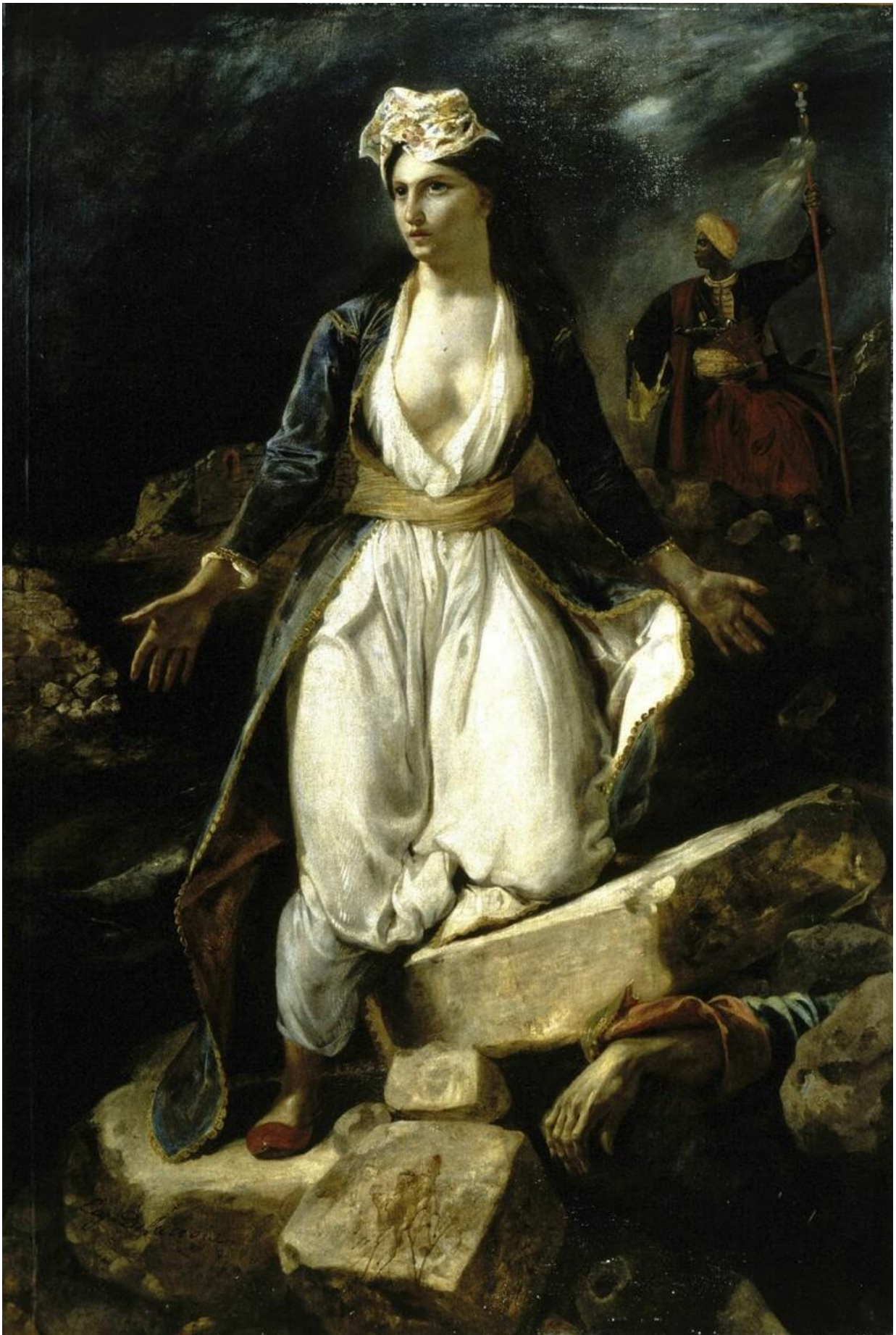
Ευγένιος Ντελακρουά: Η Ελλάς στα ερείπια του Μεσολογγίου