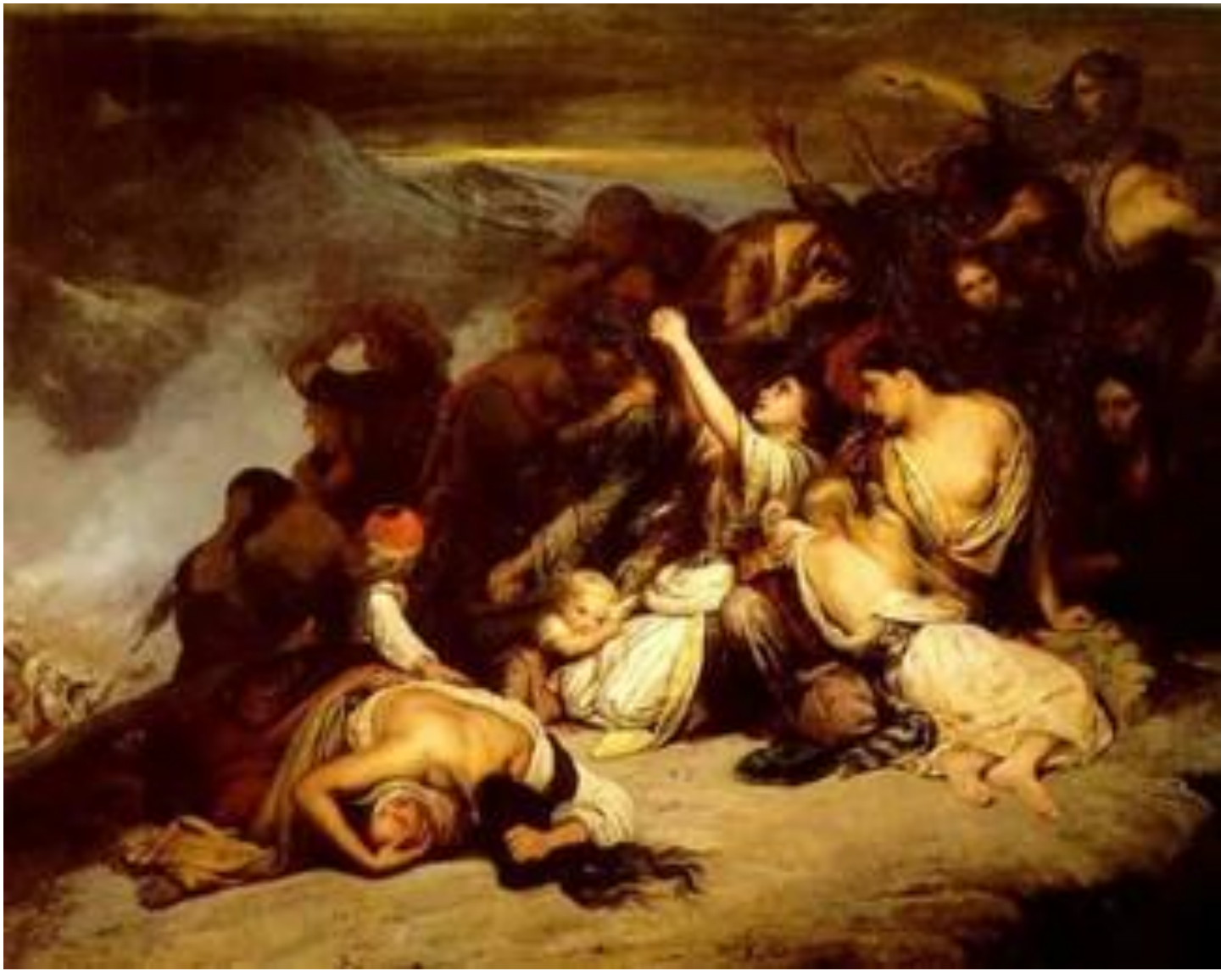
Άρι Σέφερ: Οι Σουλιώτισσες