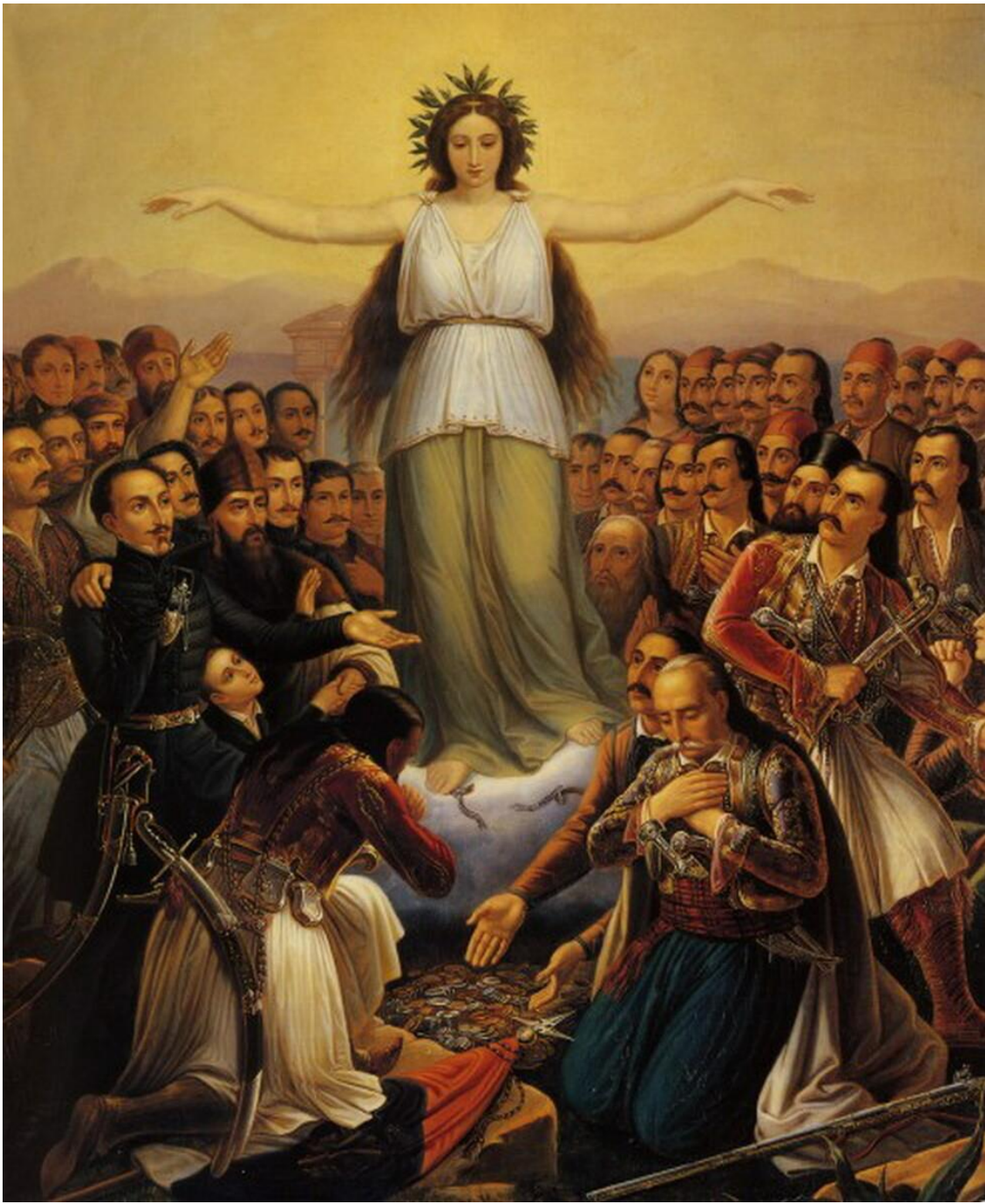
Θεόδωρος Βρυζάκης: Η Ελλάδα ευγνωμονούσα