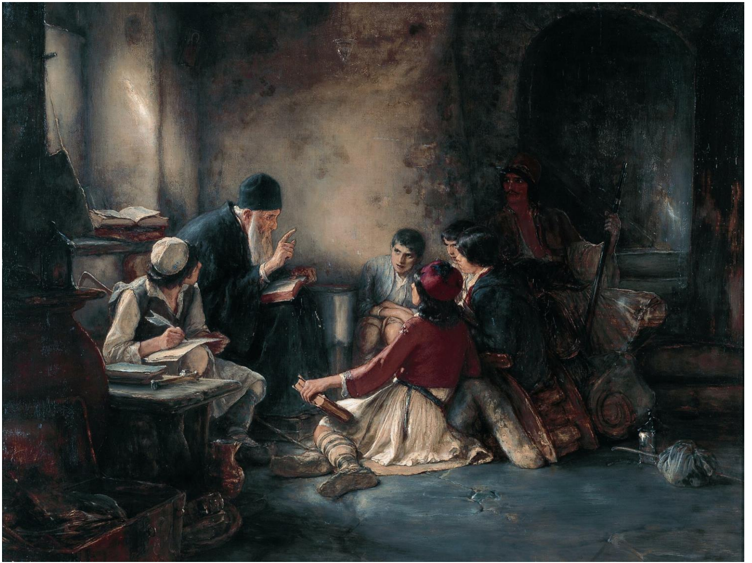
Νικόλαος Γύζης: Κρυφό σχολειό