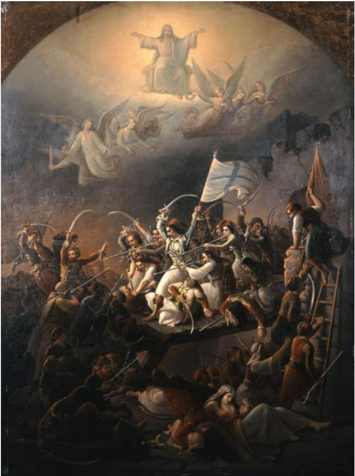
Θεόδωρος Βρυζάκης: Η έξοδος του Μεσολογγίου