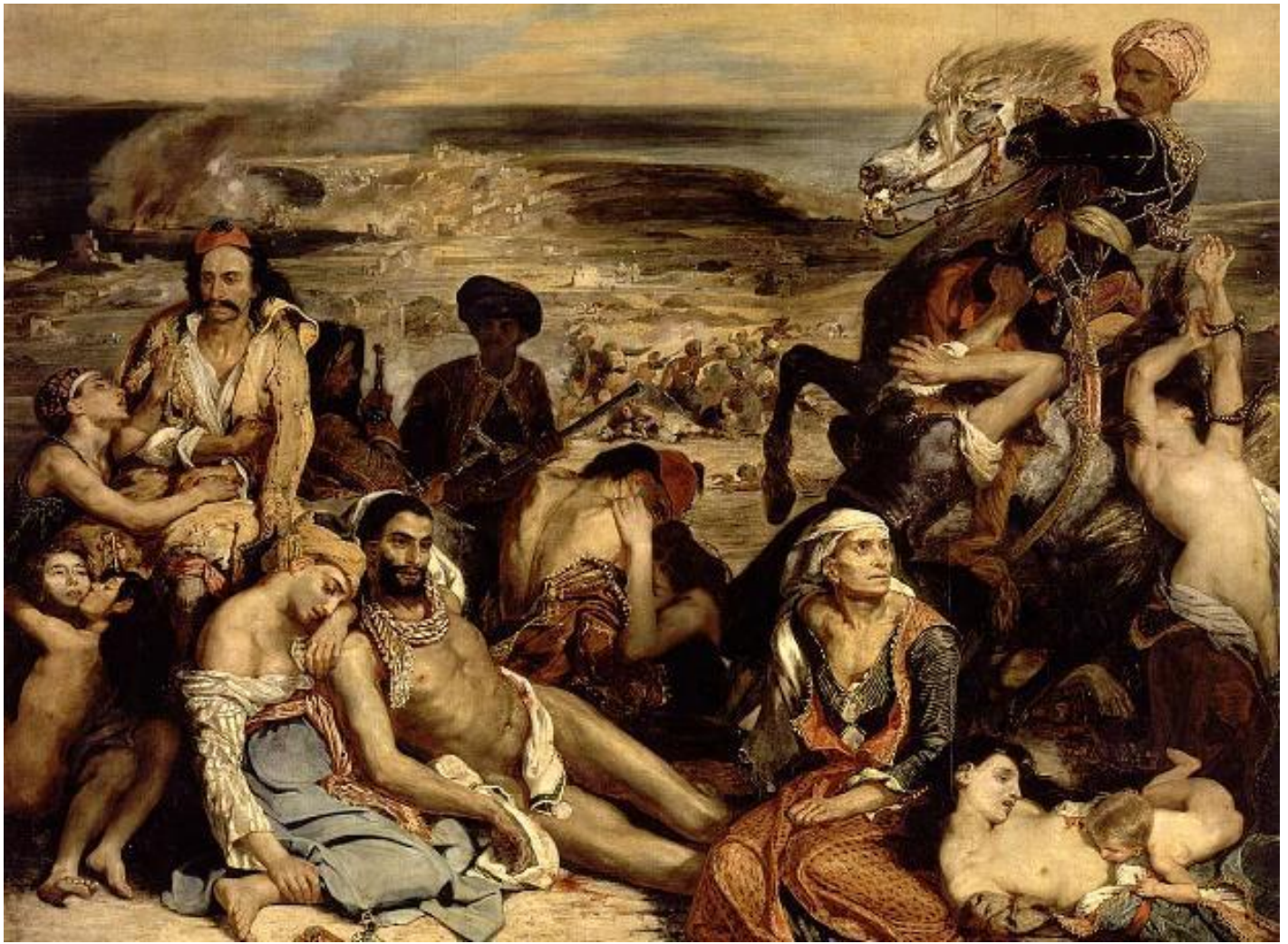
Ευγένιος Νταλακρουά: Η καταστροφή της Χίου