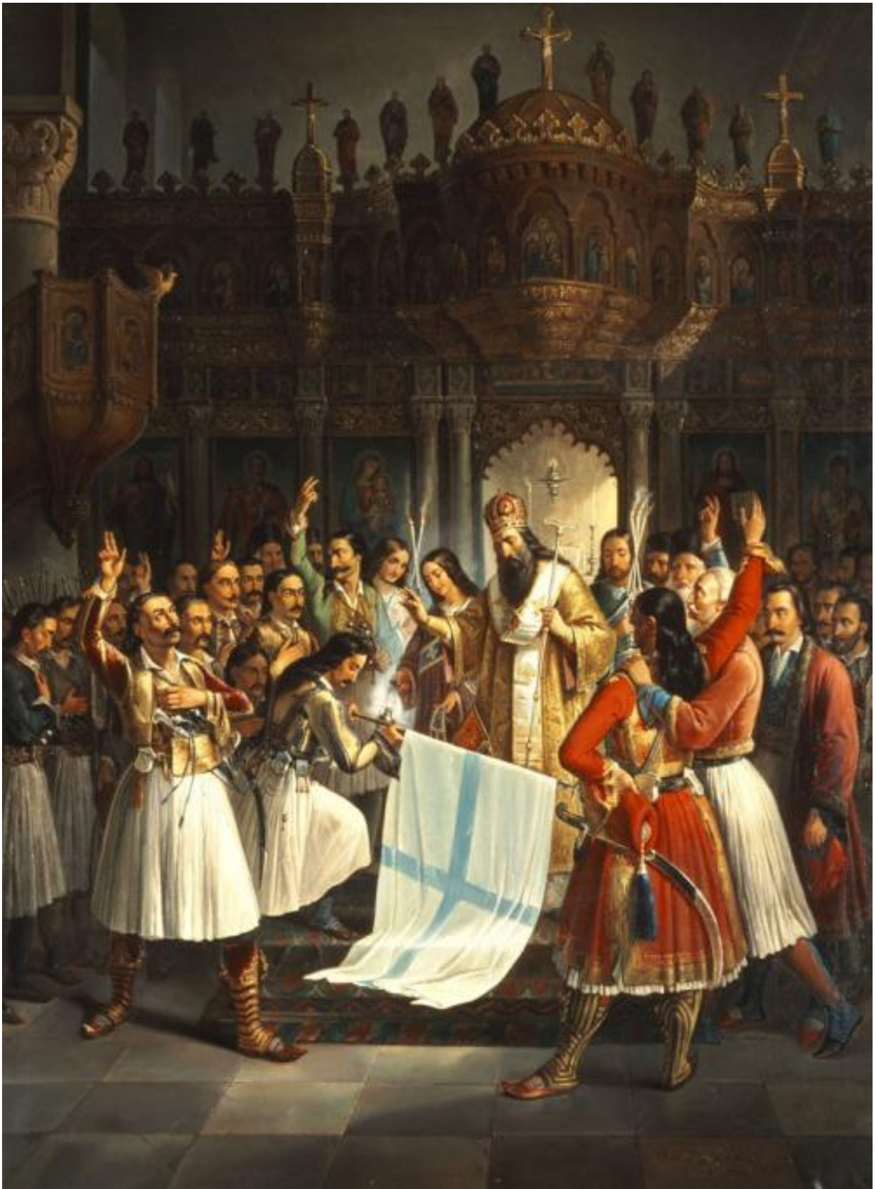
Θεόδωρος Βρυζάκης : Ο Παλαιών Πατρών Γερμανός ευλογεί τη σημαία της Επανάστασης