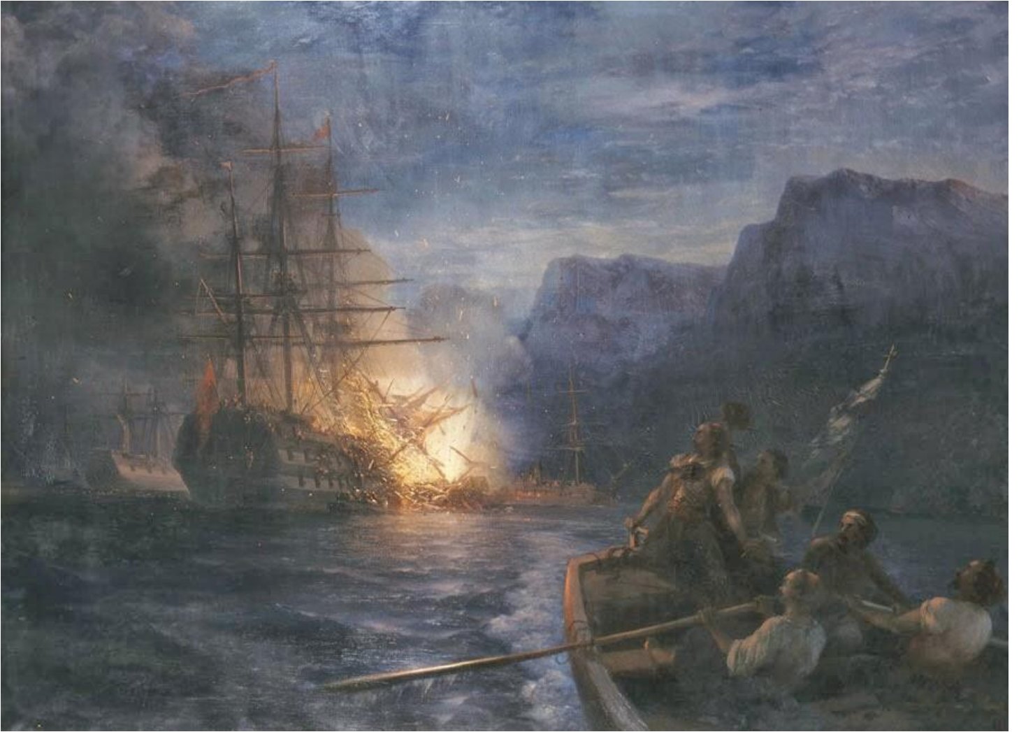
Αϊβαζόφσκι: Η πυρπόληση της τουρκικής ναυαρχίδας στη Χίο