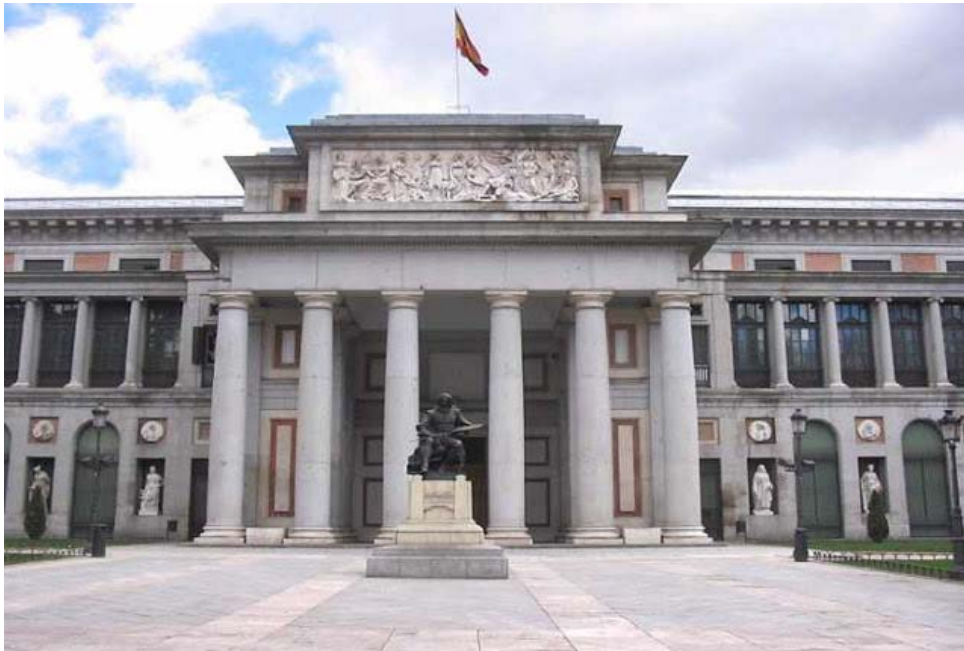
Μουσείο De Prado- Μαδρίτη

Το Μουσείο ντελ Πράδο είναι ένα περίφημο μουσείο τέχνης που βρίσκεται στη Μαδρίτη. Κατέχει μια από τις σπουδαιότερες συλλογές τέχνης του κόσμου, και συγκεκριμένα ένα μεγάλο πλήθος πινάκων από τον 14ο ως τις αρχές του 19ου αιώνα.