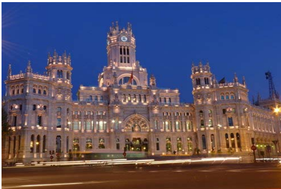
Palacio Cibeles –Μαδρίτη

Το βασιλικό παλάτι της Μαδρίτης είναι ένα από τα κορυφαία τουριστικά αξιοθέατα της πόλης και επίσημη οικία της βασιλικής οικογένειας. Σήμερα βέβαια χρησιμοποιείτε μόνο για κρατικές τελετές ενώ των υπόλοιπο χρόνο είναι ανοιχτό στο κοινό. Χτίστηκε μεταξύ του 18ου και 19ου αιώνα, αντικαθιστώντας ένα μεσαιωνικό κάστρο το οποίο κάηκε το 1794. Οι επισκέπτες μπορούν να περιπλανηθούν μέσα στα δωμάτια και της αίθουσες του παλατιού και να απολαύσουν την εξαιρετική διακόσμηση.