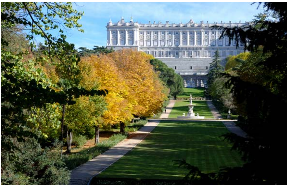
Palacio Real-Βασιλικό Παλάτι

Το βασιλικό παλάτι της Μαδρίτης είναι ένα από τα κορυφαία τουριστικά αξιοθέατα της πόλης και επίσημη οικία της βασιλικής οικογένειας. Σήμερα βέβαια χρησιμοποιείτε μόνο για κρατικές τελετές ενώ των υπόλοιπο χρόνο είναι ανοιχτό στο κοινό. Χτίστηκε μεταξύ του 18ου και 19ου αιώνα, αντικαθιστώντας ένα μεσαιωνικό κάστρο το οποίο κάηκε το 1794. Οι επισκέπτες μπορούν να περιπλανηθούν μέσα στα δωμάτια και της αίθουσες του παλατιού και να απολαύσουν την εξαιρετική διακόσμηση.