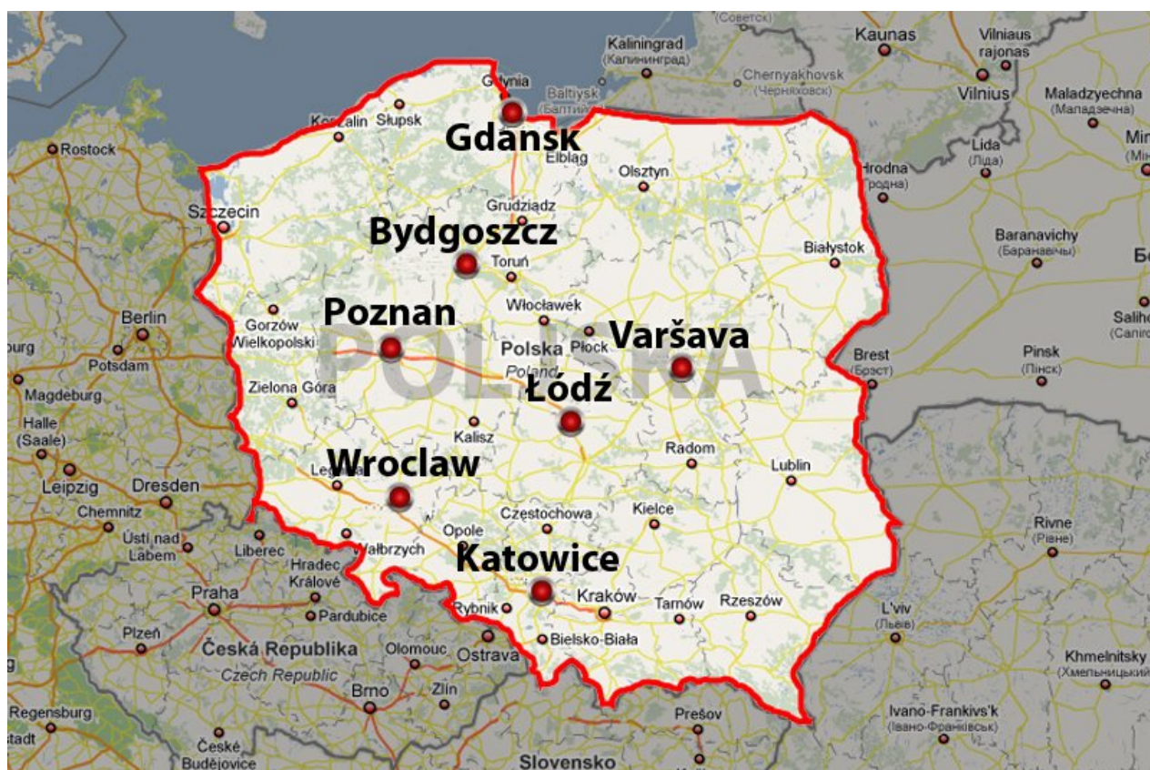
ΠΟΛΙΤΙΚΟΣ ΧΑΡΤΗΣ ΠΟΛΩΝΙΑΣ

Η Πολωνία βλέπει στη Βαλτική Θάλασσα με μια ακτή πλαισιωμένη με αμμώδεις ζώνες και λιμνοθάλασσες. Στο εσωτερικό εκτείνεται μια βαλτώδης πεδιάδα, λίγο γόνιμη, που διασχίζεται από το αυλάκι του Βιστούλα. Στα νότια εκτείνεται μια περιοχή καλυμμένη με ποταμίσια αποθέματα που τη διασχίζουν πλατιές κοιλάδες διάβρωσης. Στα δυτικά, στη Μεγάλη Πολωνία και στο κέντρο, στη Μασοβία, είναι καλλιεργημένη, αλλά προς τα βορειοανατολικά σύνορα είναι ακόμα κατά ένα μέρος ακαλλιεργητή. Τα Σουντέτι και το δυτικό μέρος των Καρπαθίων χωρίζουν την Πολωνία από τη Δημοκρατία της Τσεχίας και από τη Δημοκρατία της Σλοβακίας.