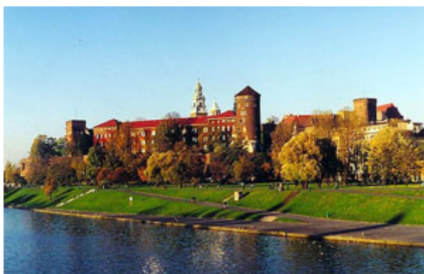
ΜΟΥΣΕΙΟ ΑΝΑΤΟΛΙΤΙΚΗΣ ΤΕΧΝΗΣ

Το κυρίως κομμάτι της, σε γοτθικό στυλ, πλαισιώνεται από άλλα διαφορετικού ρυθμού ξωκλήσια όπως το πανέμορφο Sigismund Chapel, που εύκολα ξεχωρίζει με τον επίχρυσο τρούλο του. Το ίδιο το κάστρο, στην αρχή ένα στιβαρό γοτθικό φρούριο, δέχτηκε μετατροπές αναγεννησιακού ρυθμού, για να υποστεί καταστροφές από τους Σουηδούς, τους Πρώσους αλλά κυρίως τους Αυστριακούς που θέλησαν να το διαλύσουν για να το κάνουν αρχηγείο με στρατώνες. Τώρα, ύστερα από τις αναστηλώσεις που έγιναν στις αρχές του 20ού αιώνα, είναι ένα πολύτιμο μνημείο και ένα πολύ συναρπαστικό μουσείο, όπου μπορείς να περιπλανηθείς στα βασιλικά δωμάτια με τα αυθεντικά αναγεννησιακά και μπαρόκ έπιπλα, στην Αίθουσα του Θρόνου, στο Θησαυροφυλάκιο και στο Μουσείο Ανατολίτικης Τέχνης.