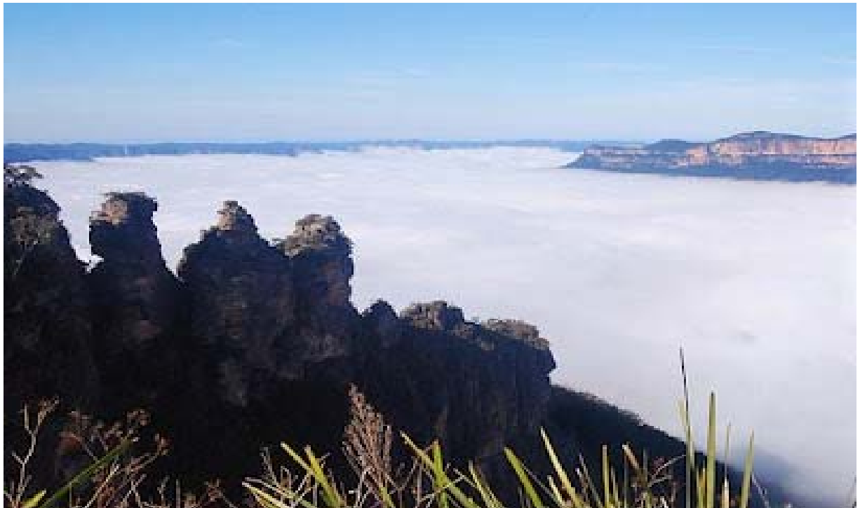
ΟΙ ΤΡΕΙΣ ΒΡΑΧΟΙ

Ευτυχώς ο μάγος, ο οποίος δεν είχε απομακρυνθεί πολύ, άκουσε τη φασαρία και έτρεξε πίσω στις κόρες του, μεταμορφώνοντάς τις σε πέτρα, για να τις σώσει από τα δόντια και τα νύχια του Bunyip. Οργισμένο το πλάσμα που έχασε το γεύμα του, γύρισε εναντίον του μάγου, ο οποίος μεταμορφώθηκε με τη βοήθεια ενός μαγικού κόκαλου, σε λύρα (πουλί) και πέταξε μακριά. Δυστυχώς όμως, ο μάγος συνειδητοποίησε ότι είχε χάσει το μαγικό του κόκαλο ενώ μεταμορφωνόταν και δεν μπορούσε πλέον να το βρει. Μέχρι σήμερα, λέγεται ότι η λύρα ψάχνει στον πάτο της κοιλάδας για να βρει το μαγικό κόκαλο, ώστε αυτός και οι κόρες του να ξαναγίνουν άνθρωποι.