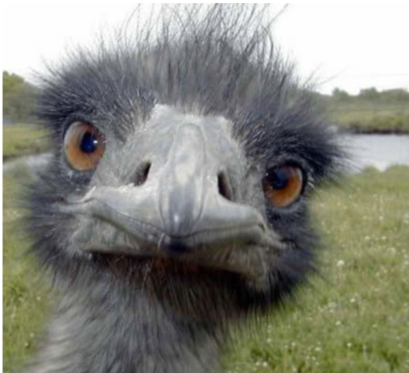
ΤΟ ΠΟΥΛΙ ΕΜΟΥ