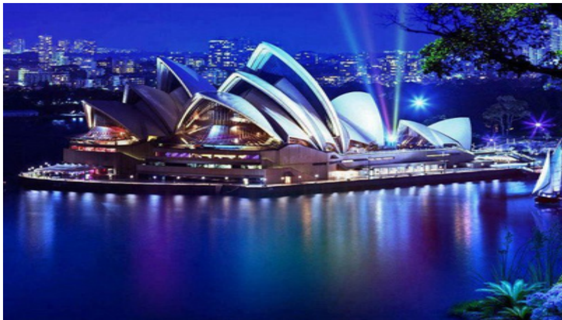
Η ΟΠΕΡΑ ΤΟΥ ΣΥΔΝΕΥ