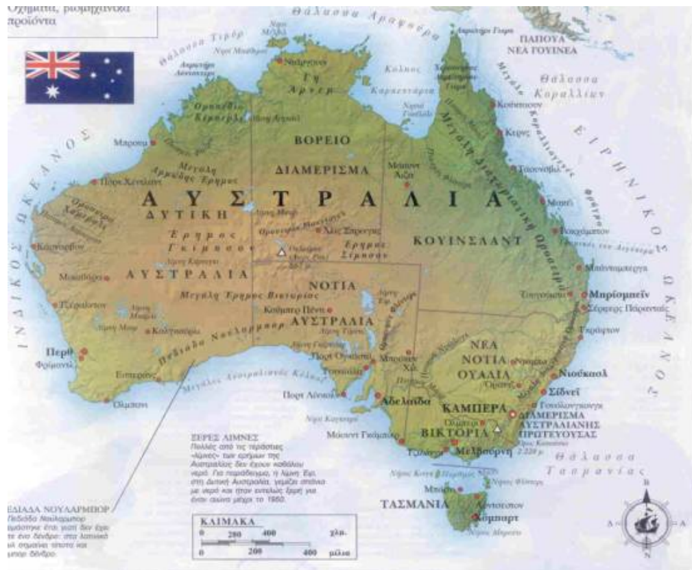
ΓΕΩΦΥΣΙΚΟΣ ΧΑΡΤΗΣ ΑΥΣΤΡΑΛΙΑΣ