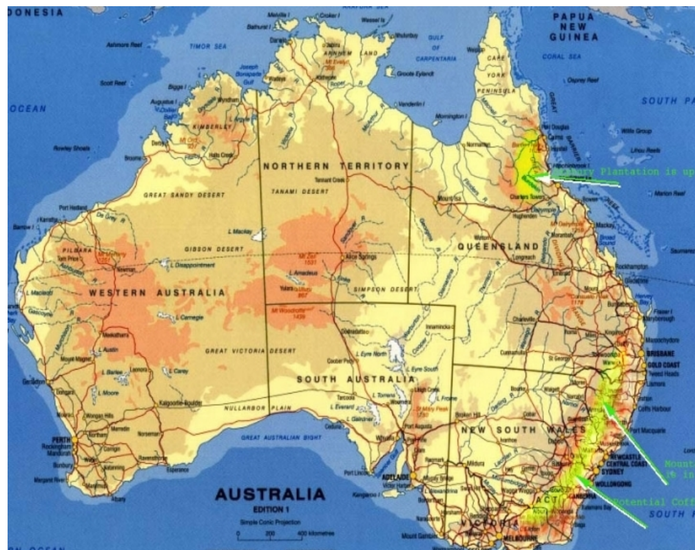
ΠΟΛΙΤΙΚΟΣ ΧΑΡΤΗΣ ΑΥΣΤΡΑΛΙΑΣ