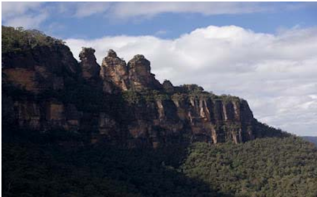
ΟΙ ΤΡΕΙΣ ΒΡΑΧΟΙ