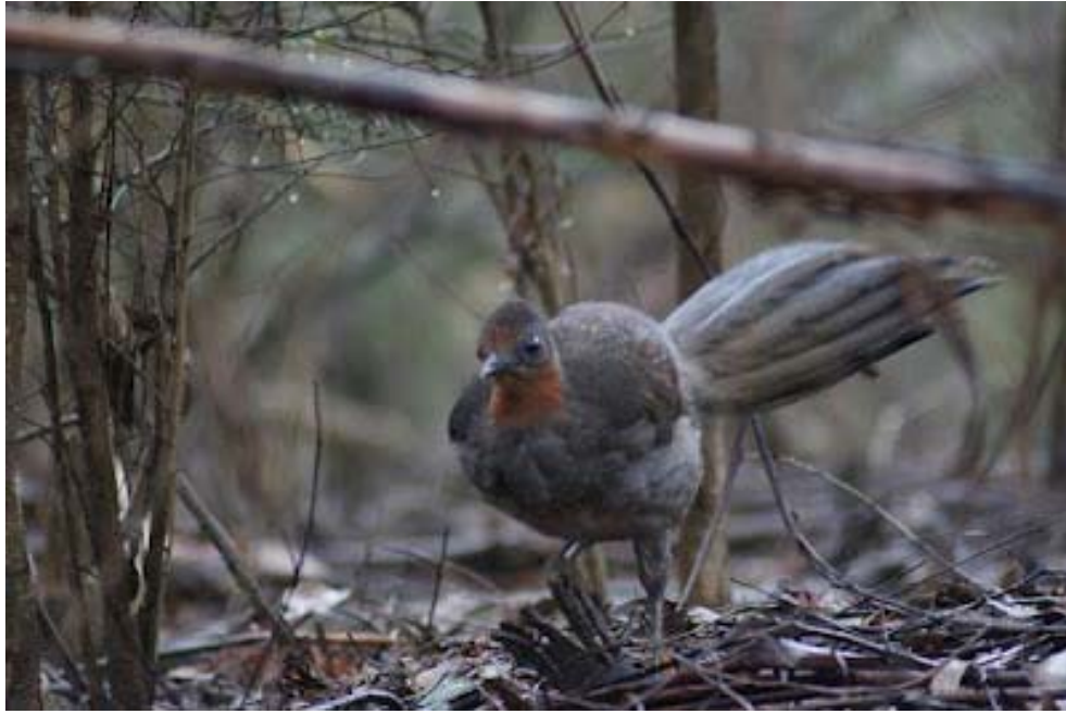
Το πουλί λύρα στην κοιλάδα