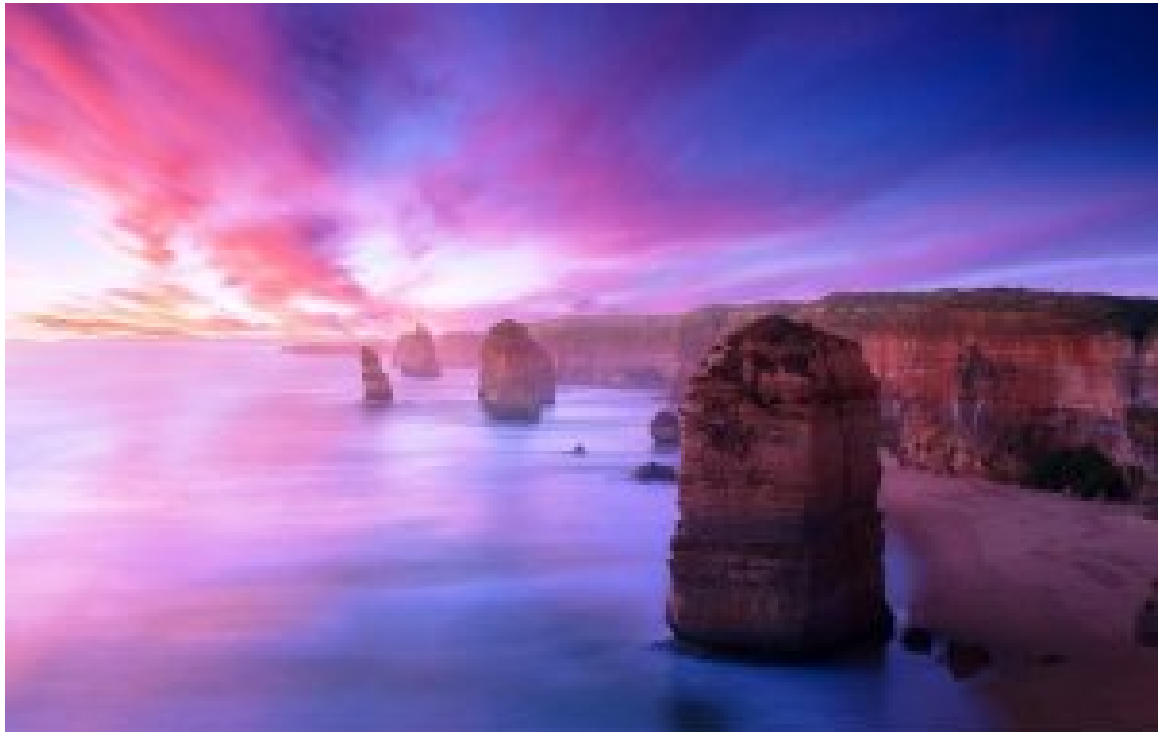
ΟΙ ΔΩΔΕΚΑ ΑΠΟΣΤΟΛΟΙ