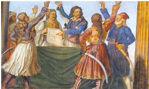
Ludwig Michael von Schwanthaler: "Η Εθνική Συνέλευση στην Επίδαυρο"

Για να εδραιωθεί η Επανάσταση, εκτός από τις πολεμικές ενέργειες χρειαζόταν και μια πολιτική οργάνωση των επαναστατημένων περιοχών. Έτσι, από την αρχή δημιουργήθηκαν τρεις τοπικές «κυβερνήσεις»: η Πελοποννησιακή Γερουσία στην Πελοπόννησο, η Γερουσία στην Δυτική Στερεά και ο Άρειος Πάγος στην Ανατολική Στερεά Ελλάδα.