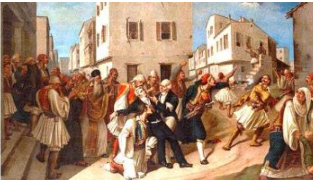
Η δολοφονία του Καποδίστρια

Η πολιτική του Καποδίστρια ενόχλησε πολλούς, από τους κοτζαμπάσηδες και τους μπέηδες μέχρι την Αγγλία και την Γαλλία. Δημιουργήθηκε, έτσι, ένα πολύ άσχημο κλίμα εναντίον του.