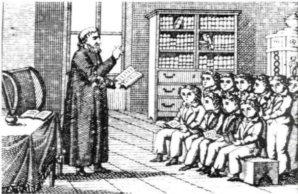
Σχολική τάξη, Τελευταία περίοδος της Τουρκοκρατίας

Θαύμαζαν τον αρχαίο ελληνικό πολιτισμό και προσπαθούσαν να μεταφέρουν και στους υπόδουλους Έλληνες την νοσταλγία για την αρχαία ελληνική δόξα. Φρόντιζαν όσο μπορούσαν για την ίδρυση και λειτουργία σχολείων στον ελληνικό χώρο.