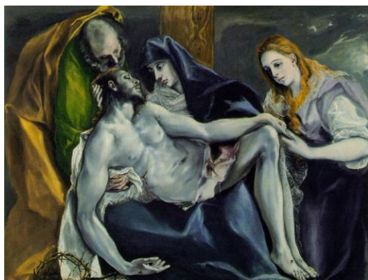
Ελ Γκρέκο: «Η αποκαθήλωση του Ιησού»

Η επαφή της καλλιτεχνικής παράδοσης της Κρήτης με τον πολιτισμό των Βενετών οδήγησε σε μία ιδιαίτερη μορφή τέχνης κατά την διάρκεια της ενετοκρατίας. Δημιουργούνται σπουδαία έργα ζωγραφικής και αναδεικνύονται σημαντικοί ζωγράφοι ( Δομίνικος Θεοτοκόπουλος ή Ελ Γκρέκο, 1541-1614, Μιχαήλ Δαμασκηνός , αρχές - τέλη 16ου αιώνα, κλπ).