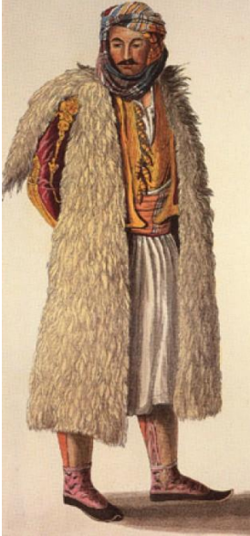
Σουλιώτης με παραδοσιακή ενδυμασία

Οι κάτοικοί του, οι Σουλιώτες, αποτελούνταν από Έλληνες και Αρβανίτες. Ήταν ορθόδοξοι χριστιανοί, μιλούσαν κυρίως αρβανίτικα, έγραφαν όμως στα ελληνικά. Ζούσαν κάτω από δύσκολες συνθήκες και από μικρή ηλικία όλοι μάθαιναν να χειρίζονται τα όπλα.