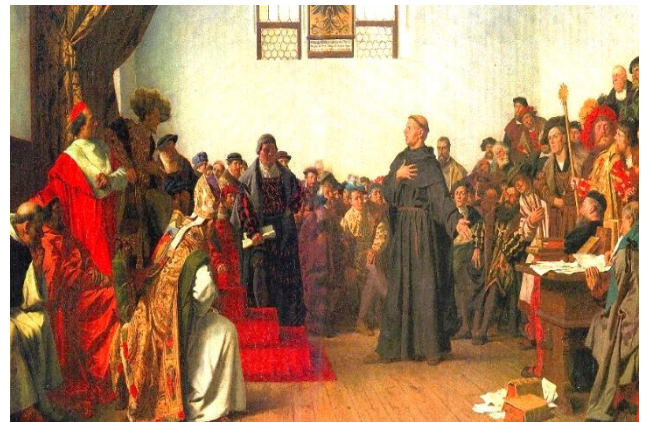
Ο Μαρτίνος Λούθηρος καλείται σε απολογία, για να ανακαλέσει τις θέσεις του (και που φυσικά αρνείται). (Έργο του Άντον φον Βέρνερ, 1877)

Ο πάπας συμμάχησε με τον Γερμανό αυτοκράτορα, ενώ αρκετοί Γερμανοί ηγεμόνες σε άλλα κρατίδια πήγαν με το μέρος τού Λουθήρου.