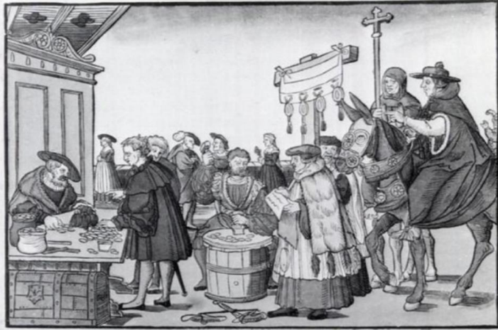
Καθολικός πάπας-υπαίθριος πωλητής συγχωροχαρτιών

Χάρης όμως στην εφεύρεση της τυπογραφίας και την διάδοση των βιβλίων, οι άνθρωποι άρχισαν πια να διαβάζουν απευθείας τα ιερά κείμενα , χωρίς να έχουν ανάγκη τις ερμηνείες της Εκκλησίας.