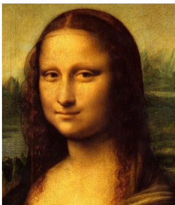
«Μόνα Λίζα (Τζοκόντα)»

Μποττιτσέλι: Ιταλός ζωγράφος. Από τα πιο γνωστά έργα του είναι «Η γέννηση της Αφροδίτης» και η «Αλληγορία της Άνοιξης».