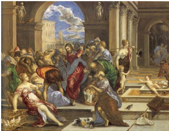
«Ο Ιησούς διώχνει τους εμπόρους από τον Ναό»

Ραφαήλ: Ιταλός ζωγράφος και αρχιτέκτονας. Από τα σημαντικότερα έργα του είναι «Η Σχολή των Αθηνών».