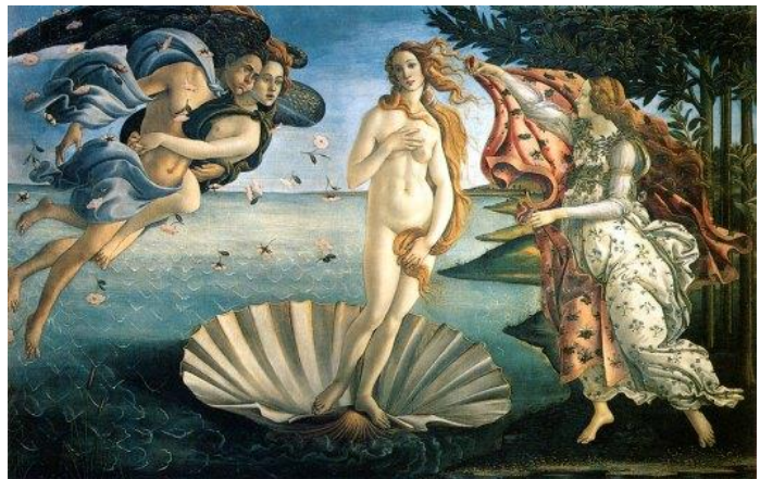
«Η γέννηση της Αφροδίτης»

Δομίνικος Θεοτοκόπουλος (Ελ Γκρέκο) (Έλληνας ζωγράφος, που έζησε στην Ισπανία)