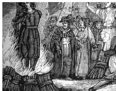
“Μάγισσα” καίγεται στην φωτιά

Στους πρώτους αιώνες της η Αναγέννηση χαρακτηρίζεται από το κυνήγι “μαγισσών” (γυναικών που τολμούσαν να υψώσουν την φωνή τους), αλλά και από την αγριότητα και τα βασανιστήρια της