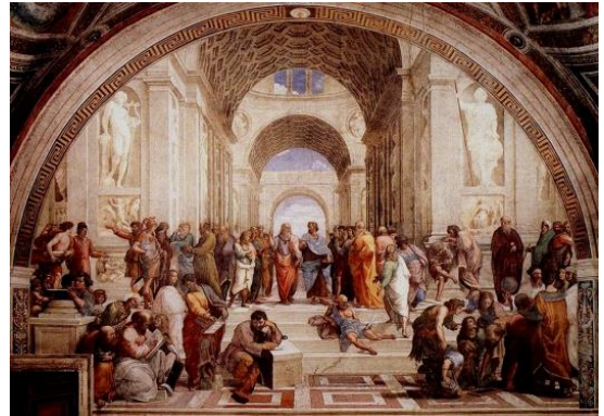
«Η Σχολή των Αθηνών»

Μιχαήλ Άγγελος: Ιταλός ζωγράφος, γλύπτης, αρχιτέκτονας και ποιητής. Σημαντικότερα έργα του οι νωπογραφίες στο παρεκκλήσιο του Βατικανού και η «Πιετά» στον Άντιο Πέτρο της Ρώμης.