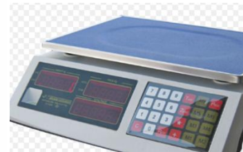
Κρεπώλη, Super Market, ...