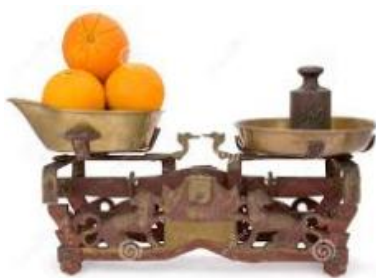
Ο ζυγός του ...μπακάλη