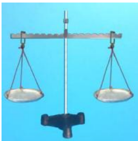
Ζυγός Σχολικού εργαστηρίου

Δείτε τα : Ζυγός, χιλιόγραμμα και τα σταθμά.