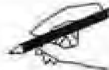
Αποδοκμός τρόπος κρατήματος του εργαλείου γραφής