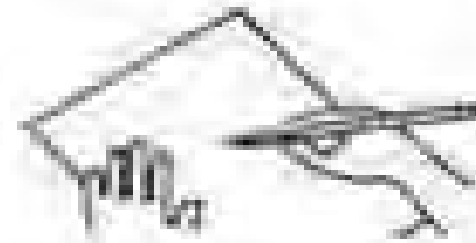
Αποδοκμή θέση επιρρόνημιος κργουσίας για αριστερόχειρες και δεξιόχειρες μαθητές