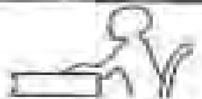
Αποδοκμή θέση πλάτης