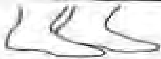
Αποδοκμή θέση ποδιών