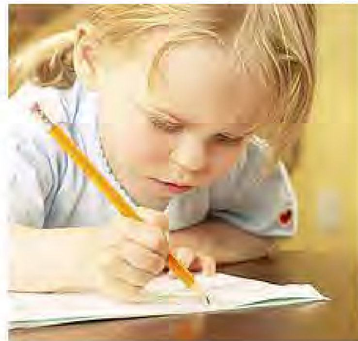
Σχήμα 3. Αποδεκτοί και λανθασμένοι τρόποι κρατήματος του εργαλείου γραφής (Mathey & Wolf 1999).