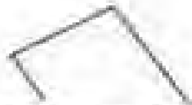
Αποδοκμή θέση επιρρόνημιος κργουσίας