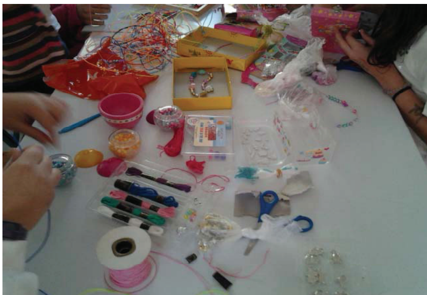
Εικόνα 2. Κατασκευή κοσμημάτων για το Χριστουγεννιάτικο Παζάρι