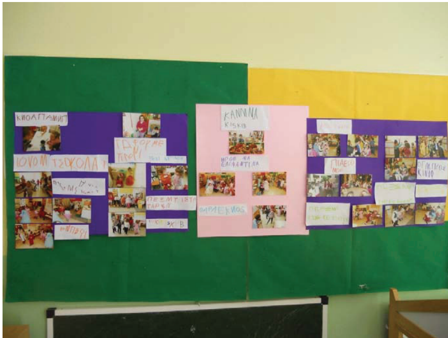
Εικόνα 4: Οι φωτογραφίες με τις επεξηγηματικές λεζάντες τους