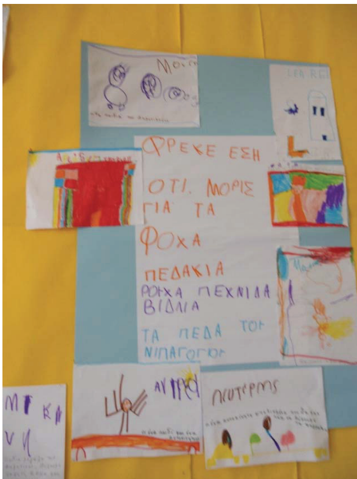
Εικόνα 2: Κατασκευή αφίσας

Τα παιδιά πρότειναν να προσκαλέσουμε και τα μεγαλύτερα παιδιά του Δημοτικού σχολείου, με το οποίο συστεγαζόμαστε. Αποφασίσαμε να φτιάξουμε μια μεγάλη αφίσα για να την δουν και να τη διαβάσουν όλοι. Άλλα παιδιά έγραψαν το μήνυμα που ήθελαν και άλλα ζωγράρισαν. Κολλήσαμε τα μηνύματα και τις ζωγραφιές και αναρτήσαμε την αφίσα στην αυλή του σχολείου (Εικόνα 2).