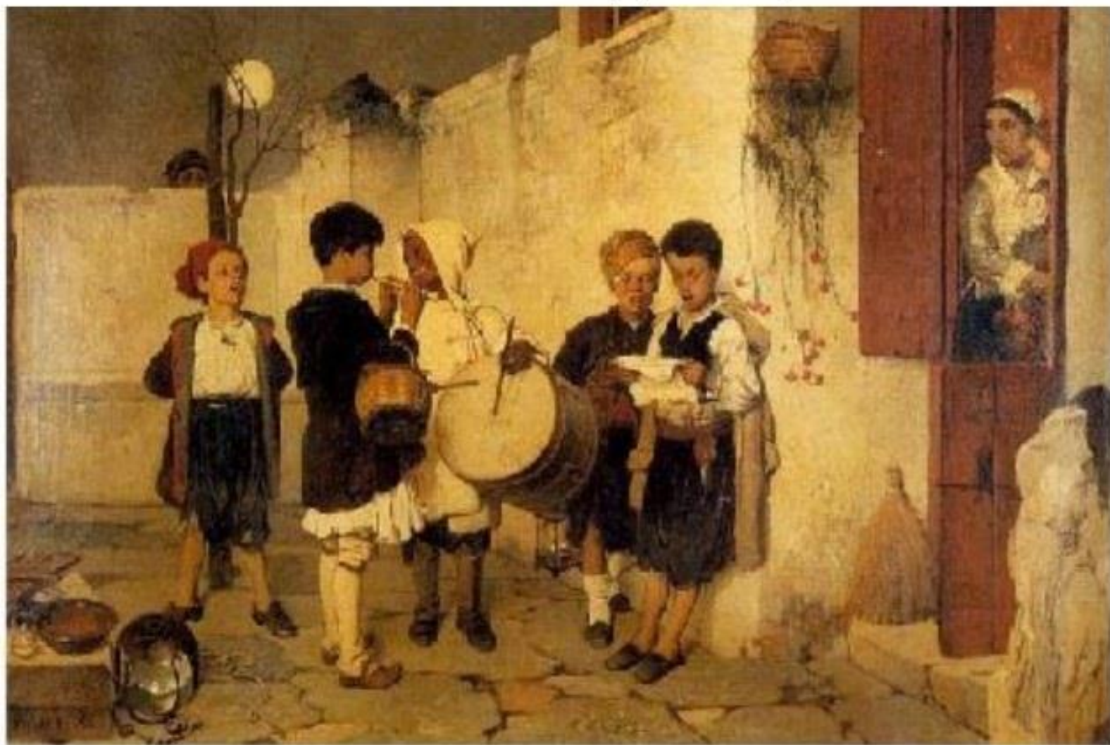
ΤΑ ΚΑΛΑΝΤΑ 1872 ΝΙΚΗΦΟΡΟΣ ΛΥΤΡΑΣ

Κύκλωσε τα Μουσικά όργανα που βλέπεις στον πίνακα