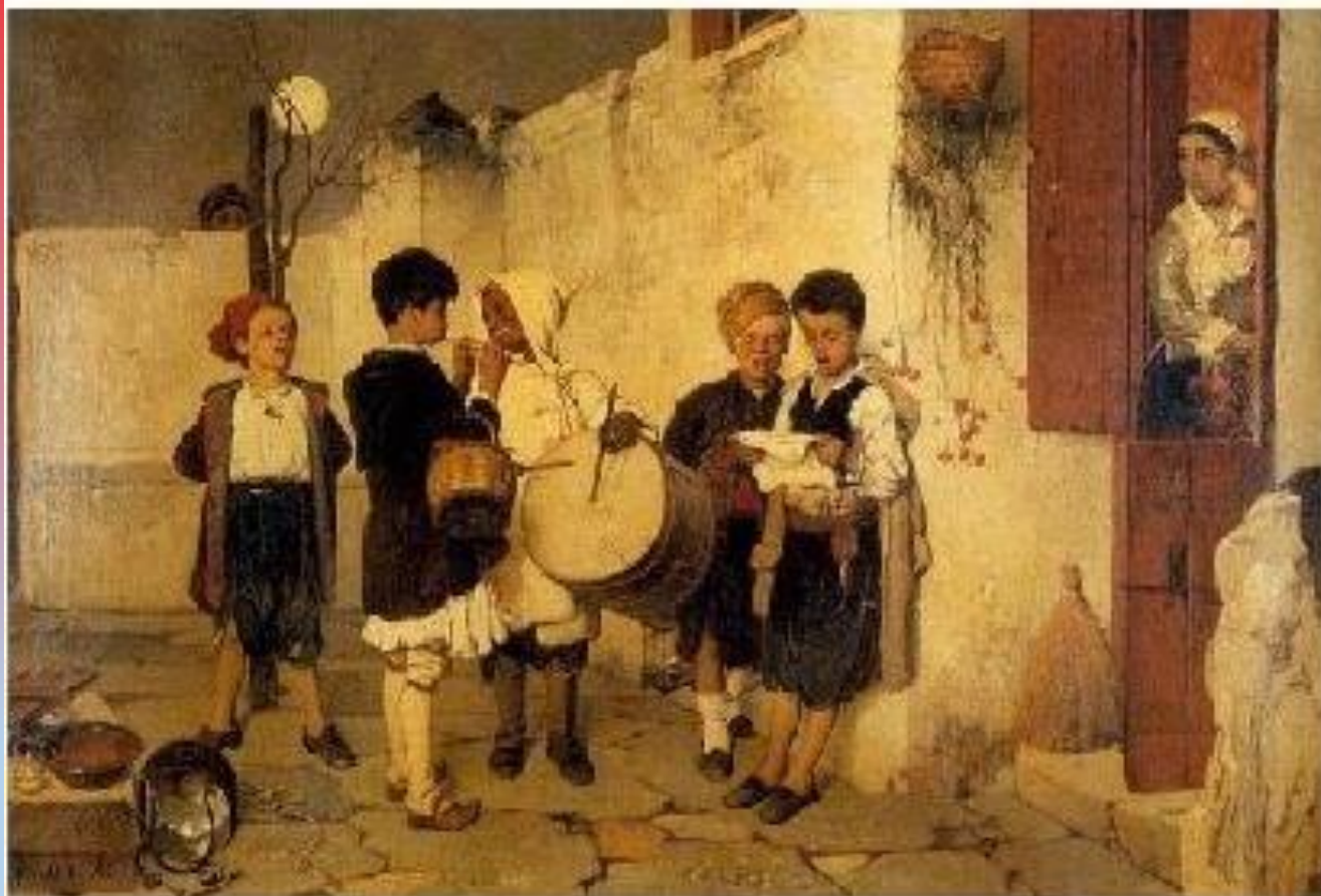
ΤΑ ΚΑΛΑΝΤΑ 1872 ΝΙΚΗΦΟΡΟΣ ΛΥΤΡΑΣ