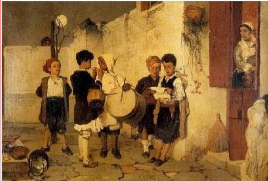
ΤΑ ΚΑΛΑΝΤΑ 1872 ΝΙΚΗΦΟΡΟΣ ΛΥΤΡΑΣ