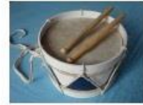
ΠΑΙΔΙΚΗ ΟΡΧΗΣΤΡΑ (1922) Tadeusz Makowski