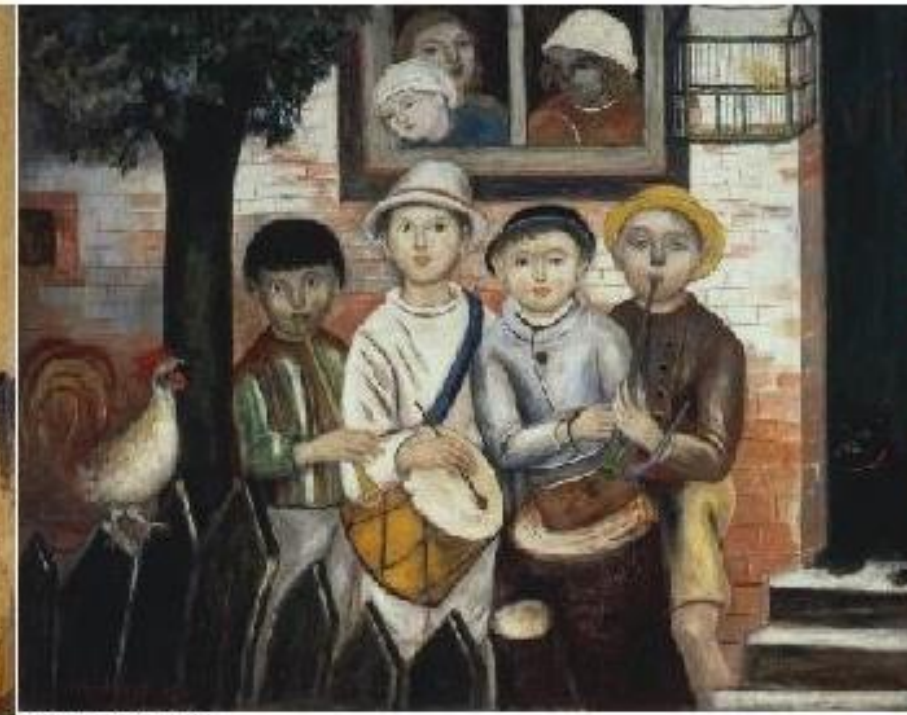
ΠΑΙΔΙΚΗ ΟΡΧΗΣΤΡΑ (1922) Tadeusz Makowski