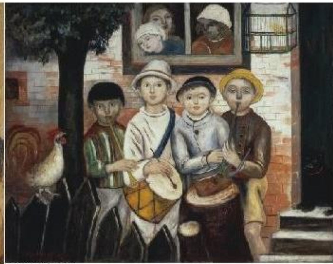
ΠΑΙΔΙΚΗ ΟΡΧΗΣΤΡΑ (1922) Tadeusz Makowski