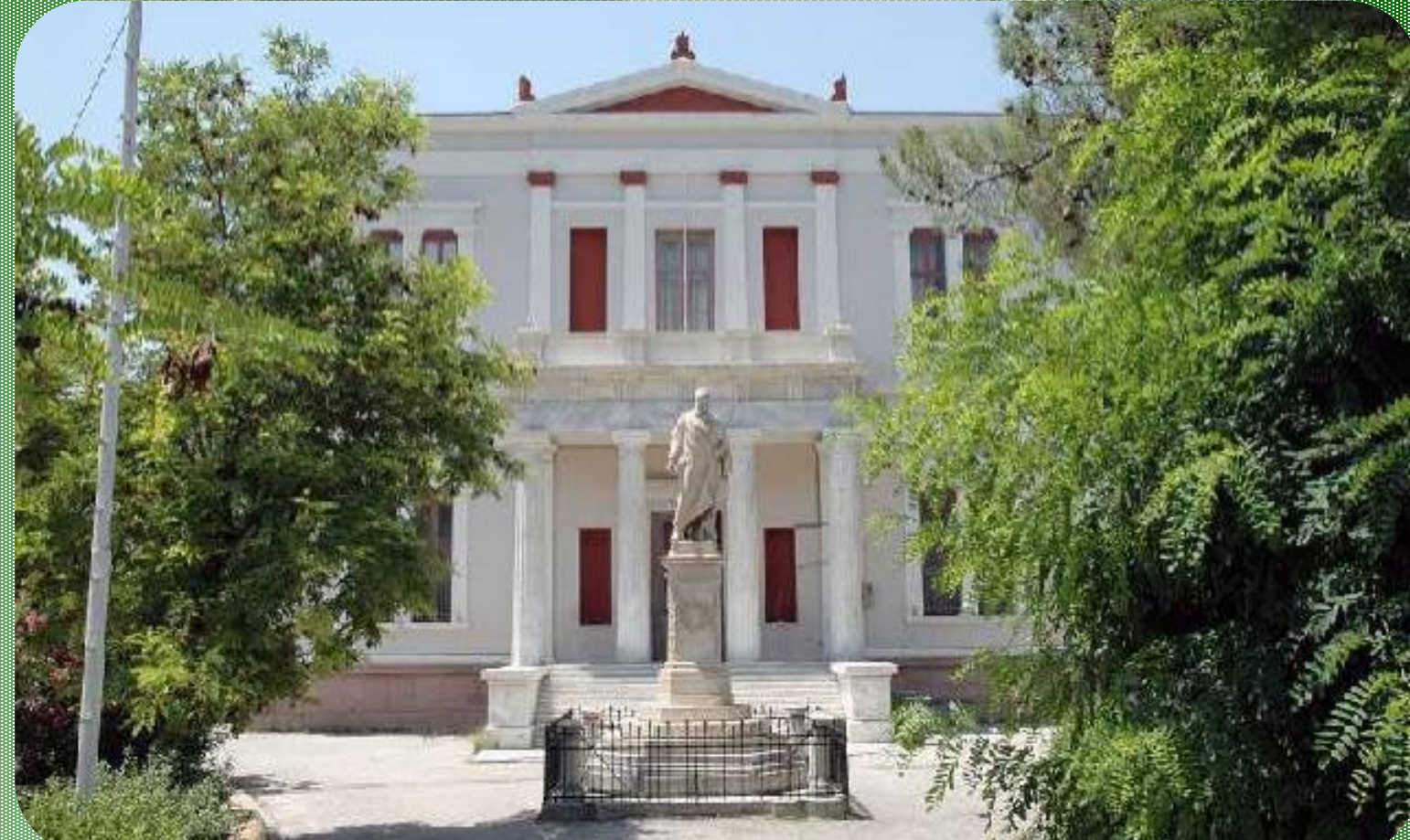
ΠΕΙΡΑΜΑΤΙΚΟ ΓΕΝΙΚΟ ΛΥΚΕΙΟ ΜΥΤΙΛΗΝΗΣ ΤΟΥ ΠΑΝΕΠΙΣΤΗΜΙΟΥ ΑΙΓΑΙΟΥ