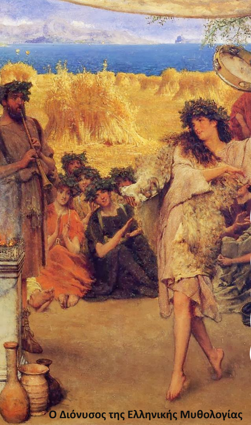
Ο Διόνυσος της Ελληνικής Μυθολογίας