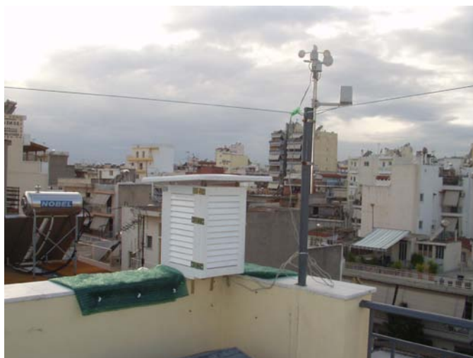
Ιδιωτικός Μετεωρολογικός Σταθμός Νίκαια-Περιβολάκι

Ο Νοέμβριος που μας πέρασε ήταν ένας μήνας , με μέτριες βροχές αλλά και ηλιόλουστες μέρες με καλή θερμοκρασία. Εντύπωση μου έκανε το φαινόμενο που παρατήρησα στις 22/11/2009 , όταν στις 11 η ώρα το βράδυ η Νίκαια είχε 13 βαθμούς και η Πάρνηθα στα 1200 μέτρα 15C ! Το φαινόμενο αυτό είχε την εξήγησή του σε αναστροφή θερμοκρασίας