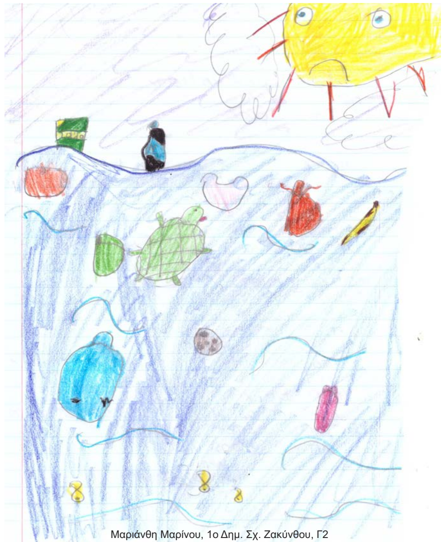
Μαριάνθη Μαρίνου, 1ο Δημ. Σχ. Ζακύνθου, Γ2