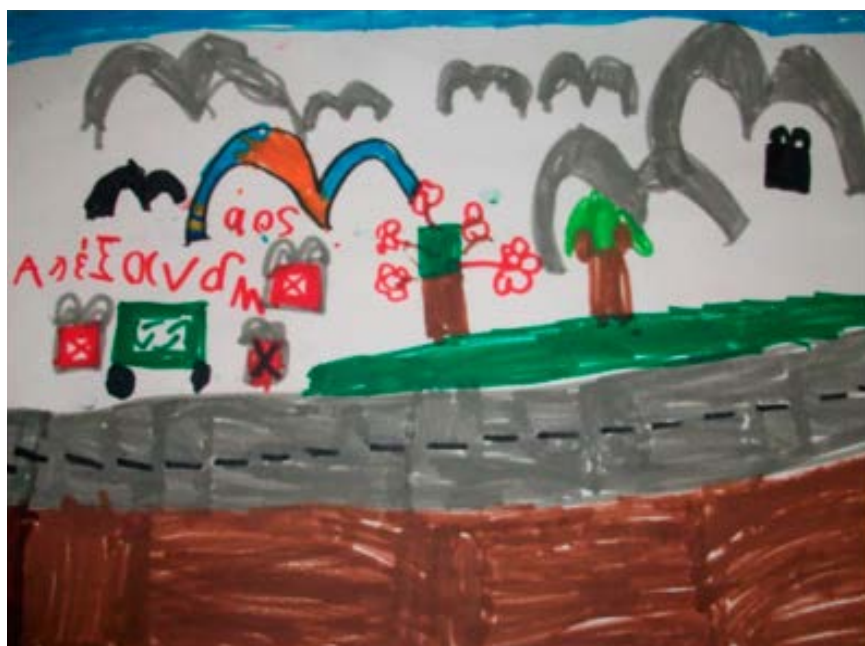
Νηπιαγωγείο Αγ. Δημητρίου

(Ακολουθεί, Γκέιμερ, Μπαμπιζαμπού, Τζώρτζμαν, Γκατζετάκιας, 1ο Δημ. Σχ. Ζακύνθου, Γ2)