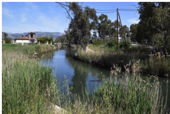
Ο Ποταμός Εράσινος

Ο ποταμός Εράσινος πηγάζει στο χωριό του Κεφαλαρίου . Στο σημείο που βρίσκονται οι πηγές του ποταμού , βρίσκεται ο ναός της Ζωοδόχου Πηγής. Διασχίζει τον Αργολικό Κάμπο . Εκεί ζούσαν πριν χιλιάδες χρόνια είναι ένα σπάνιο είδος ελαφιού, φασιανοί και πέρδικες . Ο Ερασίνοσ πήρε το όνομα του από μια αρχαία λέξη που σημαίνει αγαπητός . Σύμφωνα με την Αρχαία Ελληνική Μυθολογία ο Εράσινοσ ήταν γιος του Δία ή της Αθηνάς. Με τα νερά του ποταμού λειτούργησε το πρώτο χαρτοποιείο στην Ελλάδα.