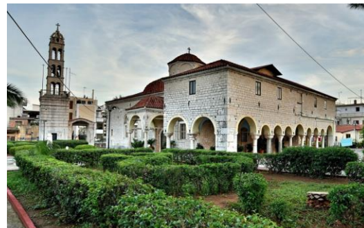
Ναός Τιμίου Προδρόμου Άργους

Ο Ναός Αγίου Ιωάννου ή Τιμίου Προδρόμου στο Άργος είναι τρίκλιτος σταυροειδής εγγεγραμμένος με τρούλο. Κτίστηκε μετά το 1822 και περατώθηκε το 1829. Στην ίδια θέση υπήρχε προγενέστερος ημιυπόγειος ναός αφιερωμένος στη Αγία Παρασκευή. Σ' εκείνον τον ναό έγινε η δοξολογία και ορκίστηκαν οι πληρεξούσιοι της Α' Εθνοσυνέλευσης το Δεκέμβριο 1821, στην αυλή του ναού άρχισαν τις εργασίες του και συνεχίστηκαν στη Νέα Επίδαυρο. Όταν έφτασε ο Ιωάννης Καποδίστριας στην επαναστατημένη Ελλάδα, ο νέος ναός δεν είχε ολοκληρωθεί ακόμα και ο κυβερνήτης ενίσχυσε το έργο οικονομικά. Προς τιμήν του Ιωάννη Καποδίστρια ο ναός αυτός αφιερώθηκε στον Άγιο Ιωάννη τον Προδρομο. Στον περίβολο του ναού έχουν ενταφιαστεί εξέχοντες Έλληνες και ξένοι φιλέλληνες.