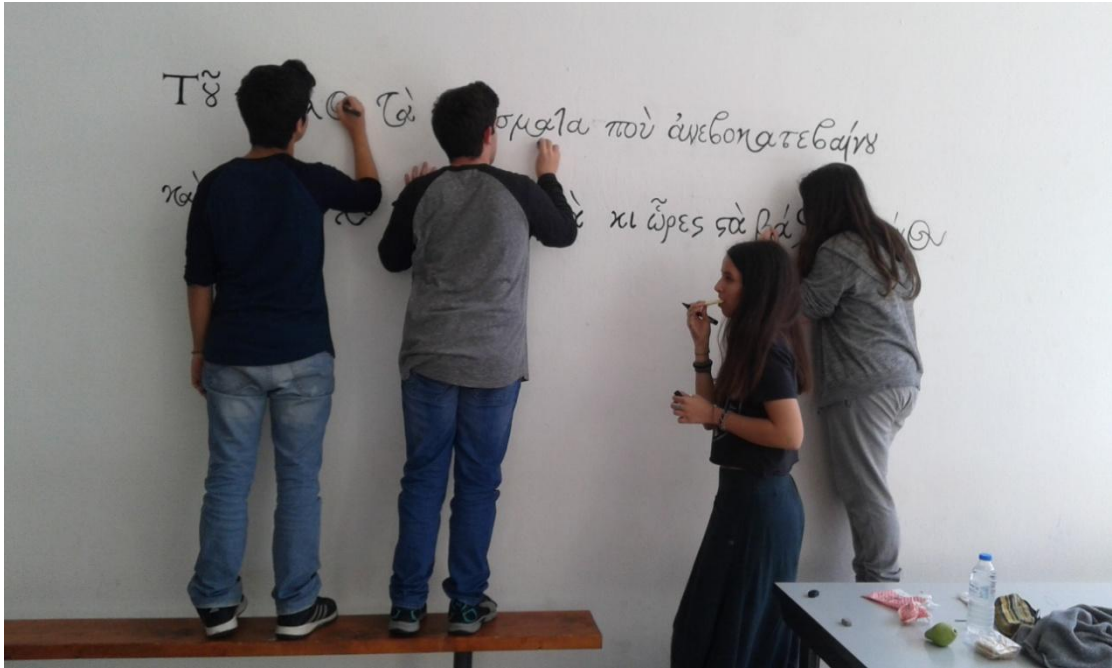
Οι καλλιτέχνες επί τῷ ἔργῳ

Στην αναγεννησιακή γραφή Grecsduroi φιλοτέχνησαν οι μαθητές και οι μαθήτριες της Β Λυκείου το α' δίστιχο από τον Ερωτόκριτο του Βιτσέντζου Κορνάρου στον εξωτερικό τοίχο της εισόδου του σχολείου μας. Το δίστιχο πλαισίωσαν με φυτικό διάκοσμο που προέρχεται από κρητικά υφαντά. Η δράση εντάσσεται στο Δίκτυο «Η Τυπογραφία της Αναγέννησης συναντά την Κρητική Λογοτεχνία μέσα από την Τέχνη του Δρόμου».