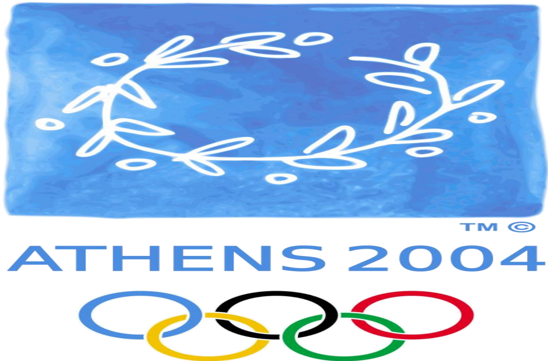
Ολυμπιακοί αγώνες , Αθήνα 2004

Κάθε χώρα που αναλαμβάνει τη διοργάνωση Ολυμπιακών αγώνων χρησιμοποιεί το δικό της πρωτότυπο σύμβολο αγώνων αλλά όλες οι διοργανώτριες χώρες έχουν ως κοινό σύμβολο τους ολυμπιακούς κύκλους.