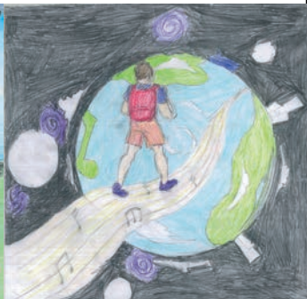
Έργα των μαθητών Γ΄ τάξης του τμήματος γραφικών τεχνών Ιου ΕΠΑΛ Σταυρούπολης

Το παρόν έντυπο τυπώθηκε τον Απρίλιο του 2015 σε 15.000 αντίτυπα για τη διοργάνωση του Φεστιβάλ Παιδείας 2015 .