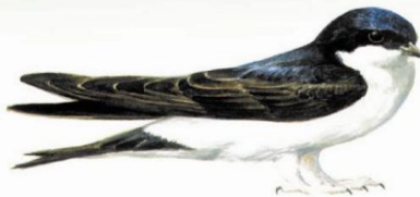
Κείμενα - φωτογραφίες: Π. Λατσούδης Σκίτσα: Π. Δουγαλής