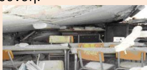
Η έδρα άντεξε το βάρος της πλάκας