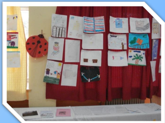
Από την έκθεση ζωγραφικής