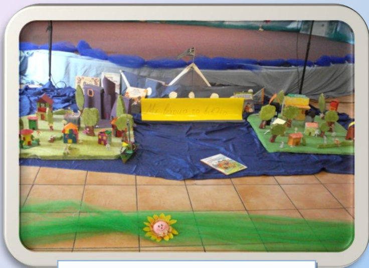
Με βάρκα το βιβλίο