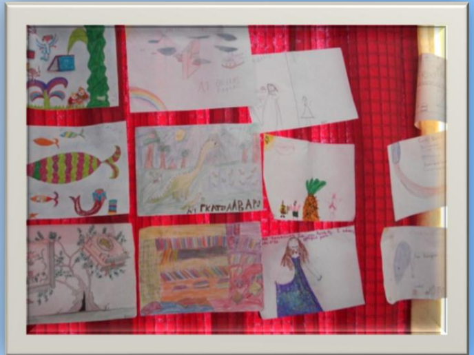
Έργα ζωγραφικής ποιήματα και παραμύθια από το διαγωνισμό