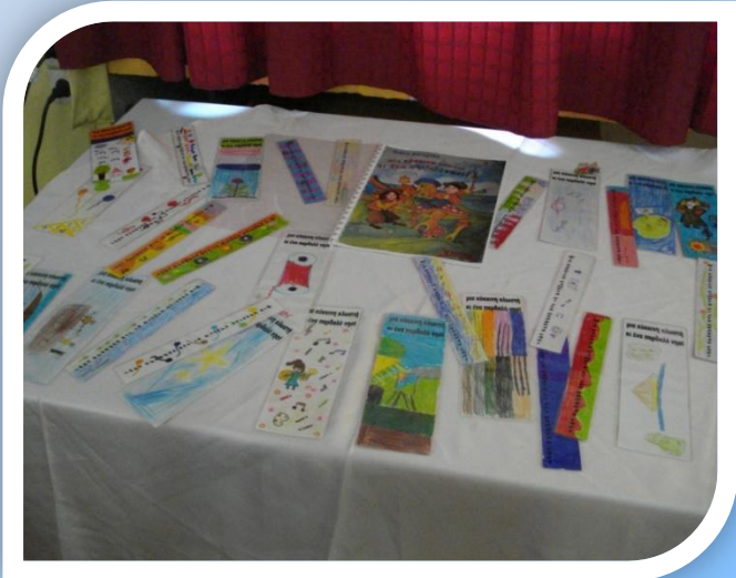
Δημιουργώντας τους δικούς μας σελιδοδείκτες