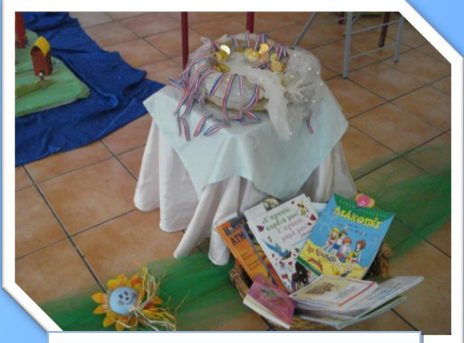
Τα βραβεία περιμένουν τους νικητές