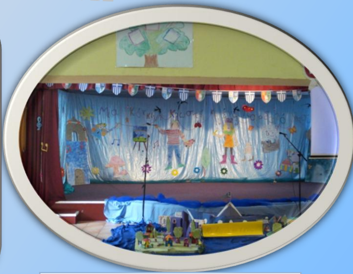
Η σκηνή μας