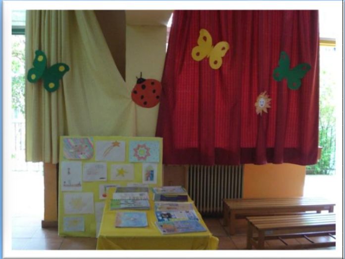
Άλλη μια άποψη της έκθεσης