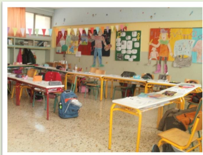
Η Γ 2 τάξη

Η συνεργασία μας με τους μικρούς ηθοποιούς ήταν πολύ ευχάριστη. Μας κάλυψαν με τις πολύ ενδιαφέρουσες απαντήσεις τους. Θα περιμένουμε με ανυπομονησία το επόμενο θεατρικό τους. Εσείς;