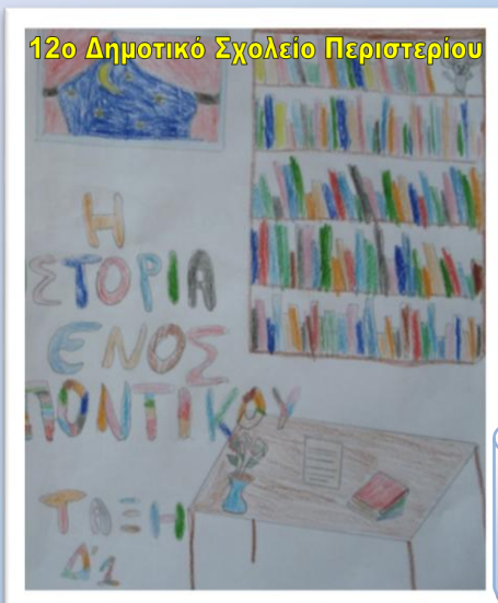
12ο Δημοτικό Σχολείο Περιστερίου

Το βιβλίο της Γ 2 τάξης Μια κόκκινη κλωστή κι ένα παρδαλό νησί