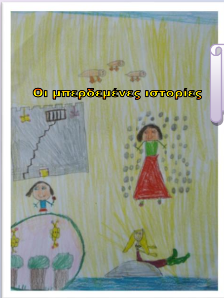
Οι μπερδεμένες ιστορίες

Το βιβλίο της Γ 1 τάξης Οι μπερδεμένες ιστορίες