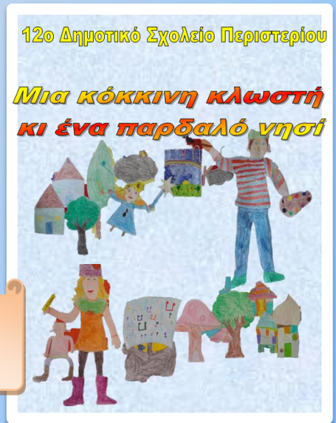
12ο Δημοτικό Σχολείο Περιστερίου

Το βιβλίο της Γ 1 τάξης Οι μπερδεμένες ιστορίες