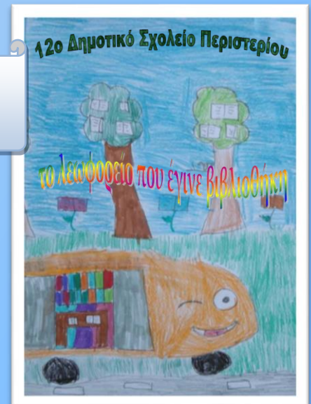
12ο Δημοτικό Σχολείο Περιστερίου

Το βιβλίο της Δ 1 τάξης Η ιστορία ενός ποντικού